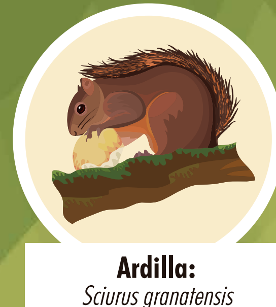
Ardilla: Sciurus granatensis