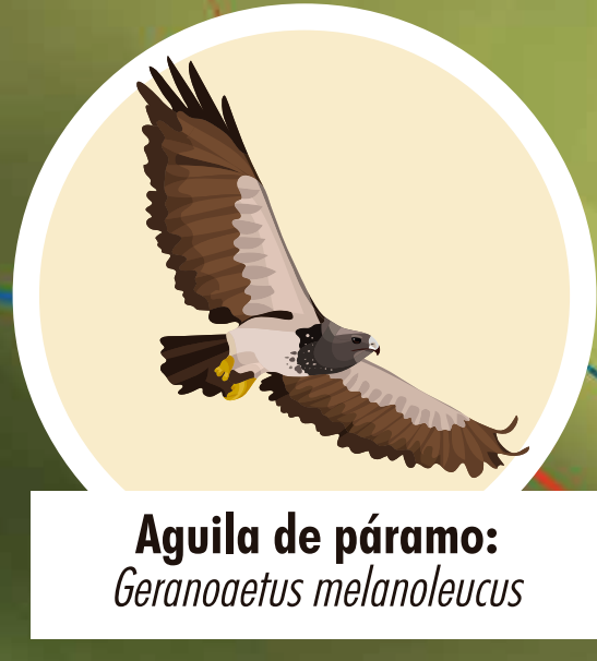
Aguila de páramo: Geranoaetus melanoleucus