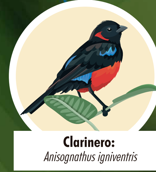
Clarinero: Anisognathus igniventris