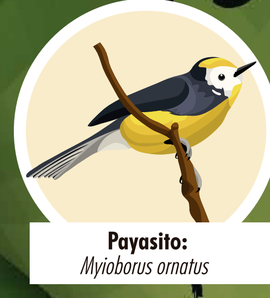
Payasito: Myioborus ornatus