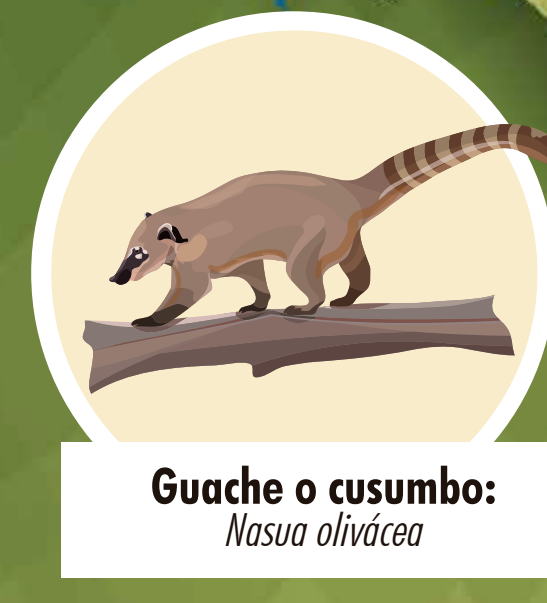
Guache o cusumbo: Nasua olivacea