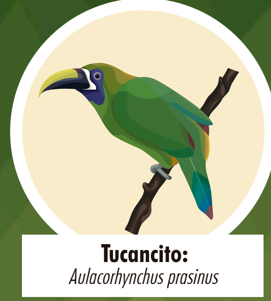
Tucancito: Aulacorhynchus prasinus