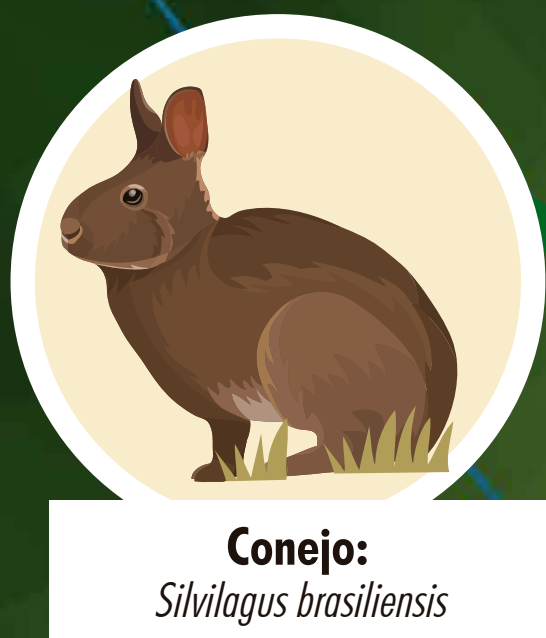
Conejo: Sylvilagus brasiliensis