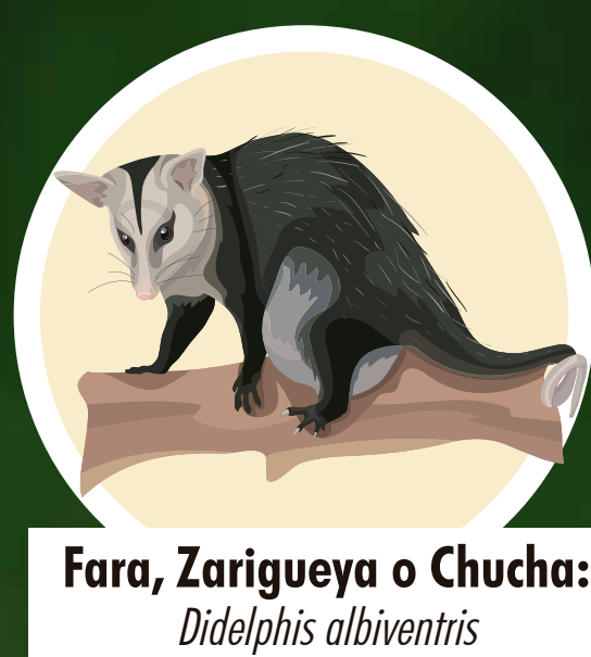
Fara, Zarigueya o Chucha: Didelphis albiventris