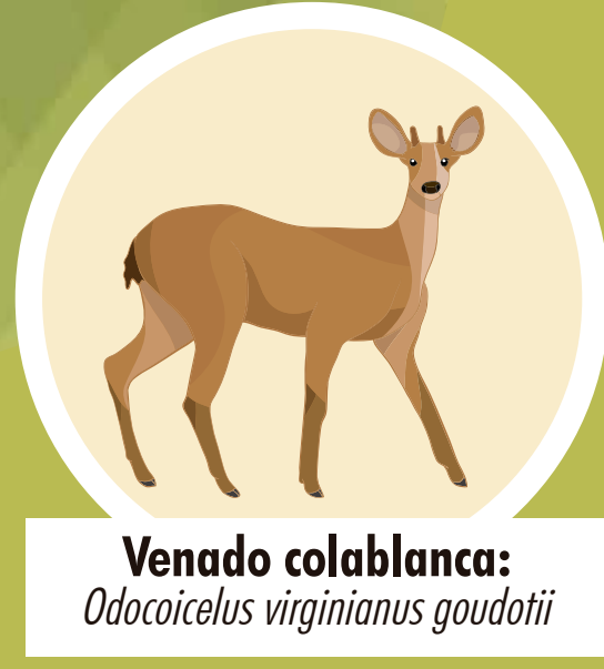
Venado colablanca: Odocoileus virginianus goudotii