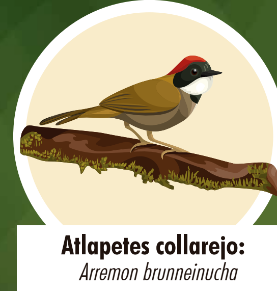
Atlapetes collarejo: Arremon brunneinucha