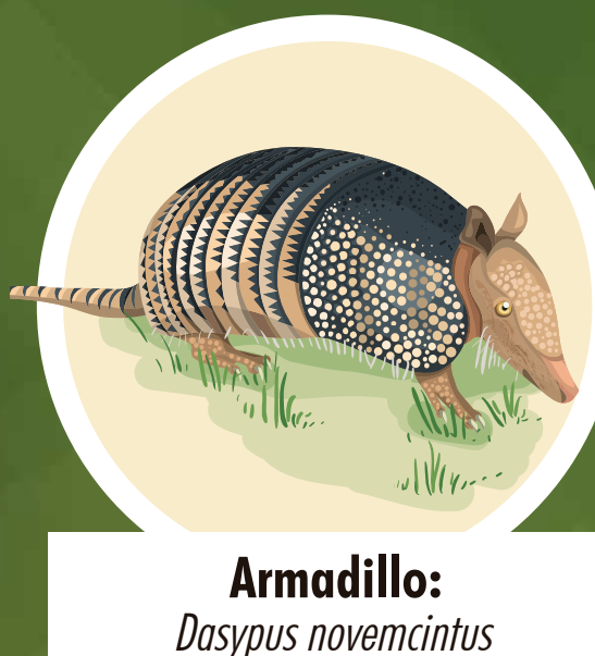
Armadillo: Dasypus novemcinctus