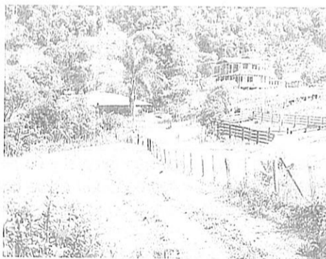
Fotografía 1. Vista general predio San Rafael.

Se caracteriza por ubicarse espacialmente en suelos de orden taxonómico inceptisol; los cuales se han dado por una evolución baja y media de las rocas, de poco desarrollo genético o suelos inmaduros, de textura arcillosa con presencia de minerales primarios y arcillas mezcladas. Su clasificación agroecológica presente es de clase VII.