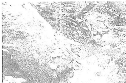
Fotografía 2. Quebrada Las Mirlas.

...Zona importante por la protección que provee contra los procesos erosivos hídricos y por la cobertura vegetal que evita el arrastre de sedimentos, así mismo actúa en la regulación hídrica para el río Nima ya que es un afluente directo a él. Se encuentra en estado de recuperación, ya que el propietario manifiesta que esta área durante más de 4 años no ha sido intervenida, no se efectúan talas ni tampoco actividades de cacería, pero se resalta la necesidad de aislar estos relictos de bosque para mantener mejor su estado de recuperación y conservación que a su vez le favorece debido a las pendientes escarpadas (más del 50%) que dificultan el acceso a estas zonas de Bosque..."