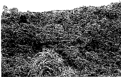
Figura 1. Vista del predio El Cedral.

"(...) En los costados del predio, se encuentra vegetación en un estado de regeneración inicial, con algunos árboles aislados que aún sobreviven. La vegetación predominante son melastomatáceas y piperáceas, junto con algunas especies como caspi, ( Toxicodendron striatum ), abundante, alma negra, guayacán morado ( Delostoma integrifolium ), mulato ( Cordia sp. ), zurrumbo, tachuelo, flor amarillo, unos pocos individuos de cedro negro, laurel y encenillos. Así mismo, en la parte alta del predio aún se conserva un fragmento de buena forma y tamaño de bosque secundario, donde la intervención en los últimos años ha sido poca, encontrándose un sotobosque denso y árboles de buena forma y tamaño (...)"