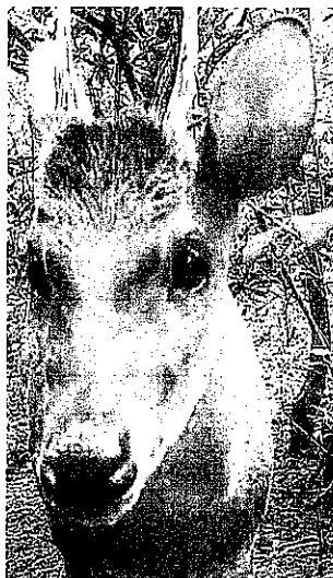
Imagen 2. Cauquero ( Mazama americana ). Tomado del informe técnico enviado por Corpoguajira.