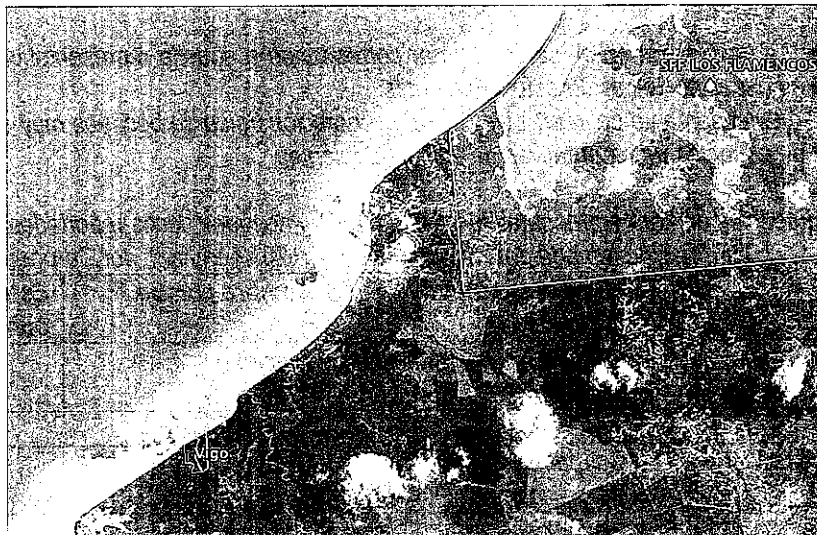
Imagen 1. Localización del predio Vigo respecto a los límites del Santuario de Fauna y Flora Los Flamencos. Tomado del informe técnico enviado por Corpoguajira.

(...) 1. Características generales del predio: El predio Vigo se encuentra localizado en el corregimiento de La Punta de Los Remedios, jurisdicción del municipio de Dibulla, a aproximadamente 37 km del municipio de Riohacha, y a una distancia aproximada de 5,9 Km del Santuario de Fauna y Flora Los Flamencos, en el departamento de La Guajira.