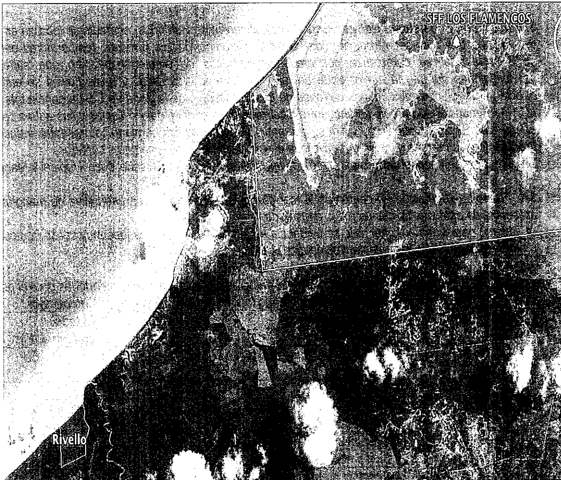
Imagen 1. Localización del predio Rivello respecto a los límites del Santuario de Fauna y Flora Los Flamencos.

(...) 1. Características generales del predio: El predio Rivello se encuentra localizado en el corregimiento de La Punta de Los Remedios, jurisdicción del municipio de Dibulla, a aproximadamente 37 km del municipio de Riohacha, y a una distancia aproximada de 7 Km del Santuario de Fauna y Flora Los Flamencos, en el departamento de La Guajira.