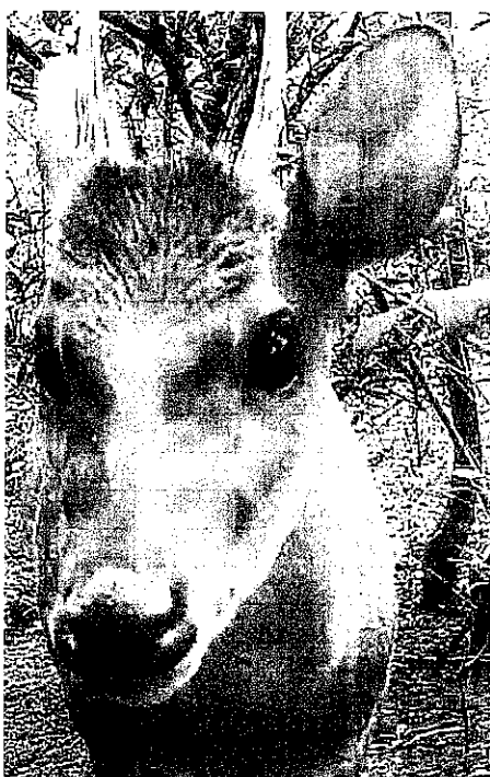
Imagen 2. Cauquero ( Mazama americana ). Tomado del informe técnico enviado por Corpogujaira