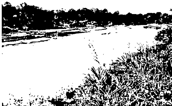
Fotografías 6 y 7 Sacos ubicados al margen derecho del rio Palomino zona en donde el caudal es más alto y el nivel de retención del banco de arena se deposita aguas abajo presenta una longitud aproximada de 180 metros