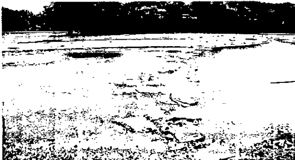
Fotografía 1. Vista panorámica del Rio Palomino y las obras que intervinieron el cauce