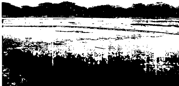
Fotografías 2 y 3 Barrera artesanal para desviar el cauce del rio hacia la entrada de la bocatoma 50 metros de sacos