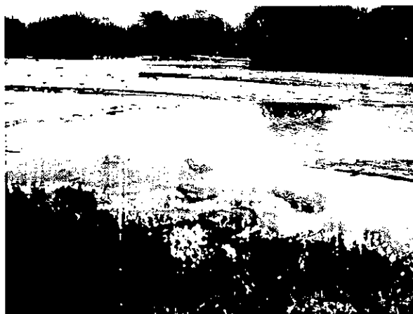
Fotografías 4 y 5 Entrada bocatoma Finca Kasuma sacos que presentan el deterioro por el arrastre de sedimentos ocasionados por el cauce del rio