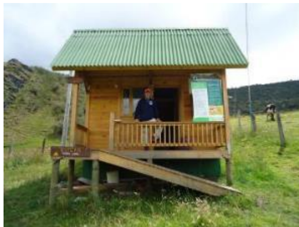
Cabaña sector La Esperanza