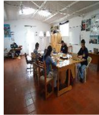
Oficina Sede Administrativa

La sede administrativa en el Municipio de Tame, en la carrera 22. N° 15-04 barrio el Cielo Telefax 097-8886054