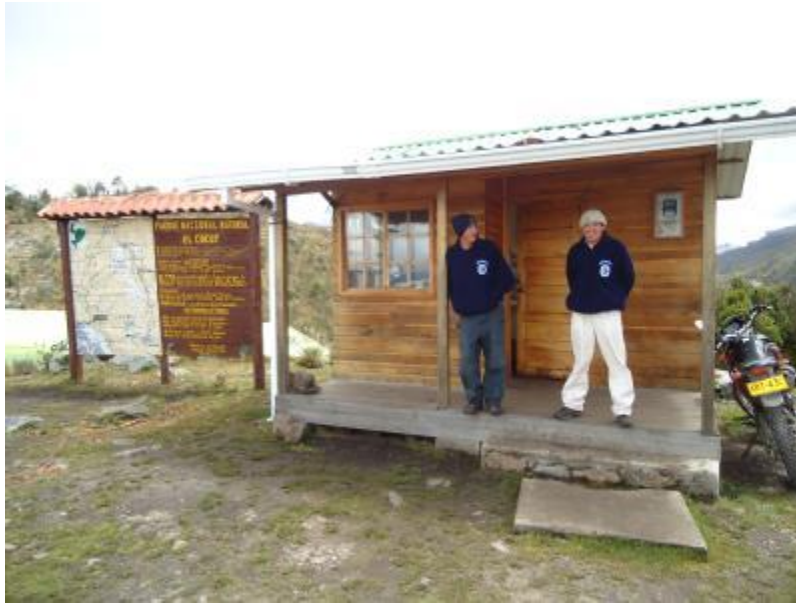
Cabaña Puerta de Lagunillas