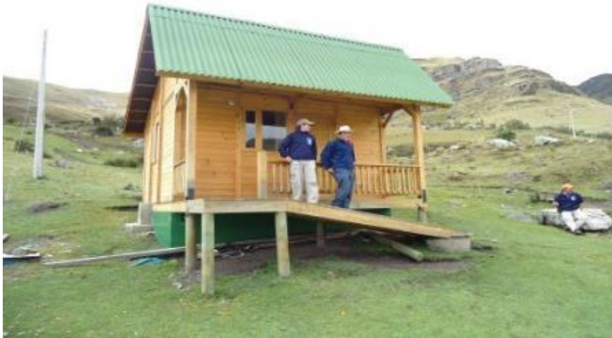
Cabaña Sector Ritacubas (sector Norte Sierra Nevada)