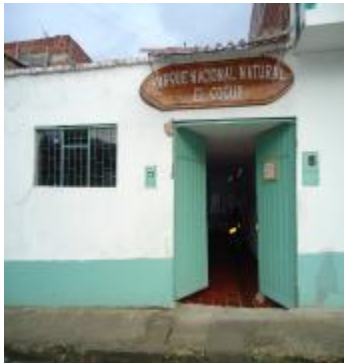
Frente sede administrativa PNN EL COCUIY

La sede administrativa en el Municipio de El Cocuy, en la calle 5ª. N° 4-22 frente a la Plaza de Mercado Telefax 098-7890359