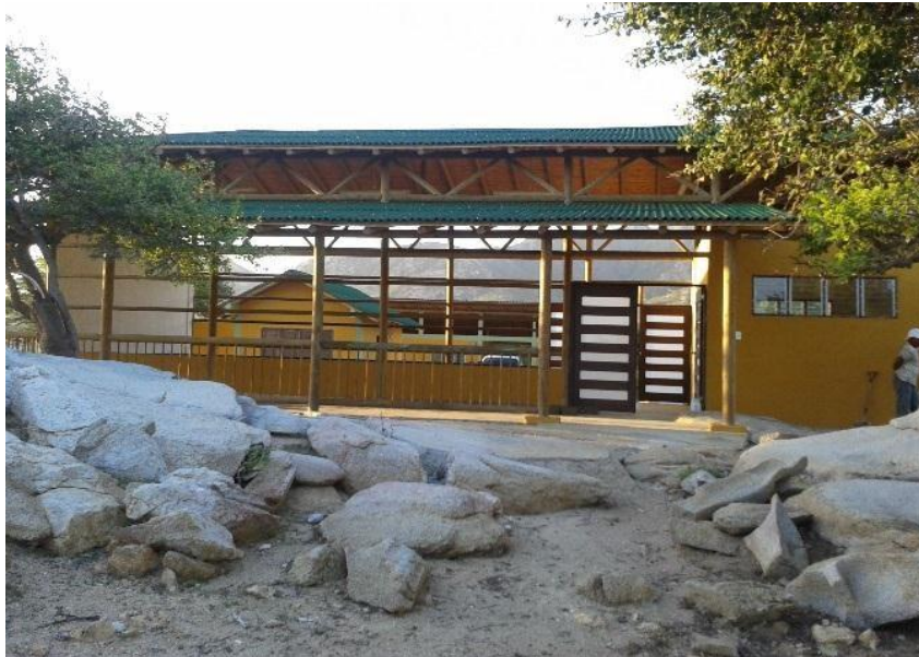
Sede para funcionarios Siapana