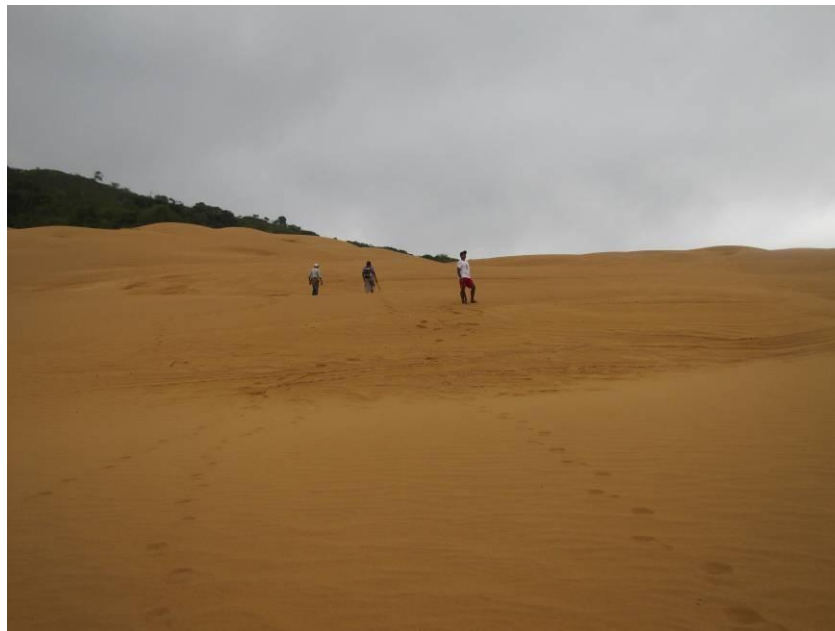
Médano de Aleworou