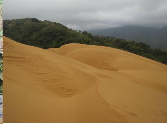
Médano de Aleworou