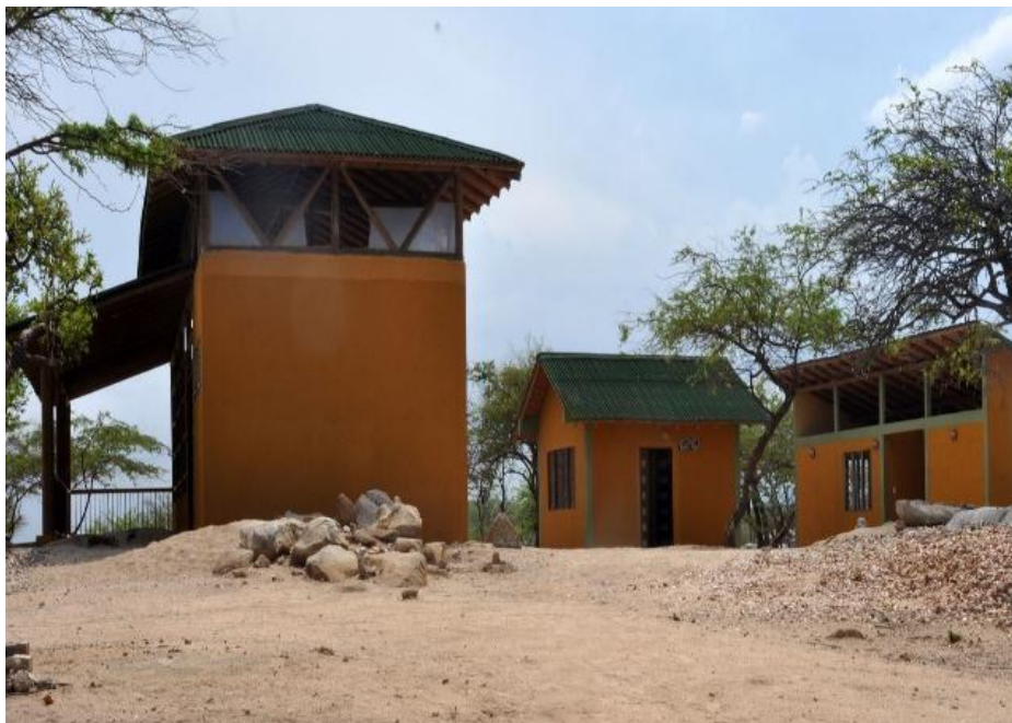
Sede para funcionarios Siapana