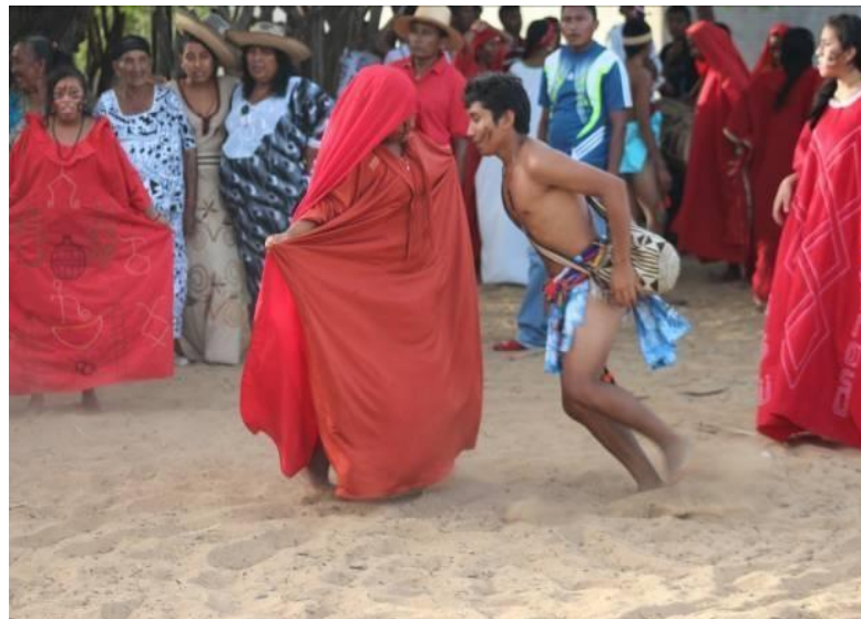
Baile de La Yonna