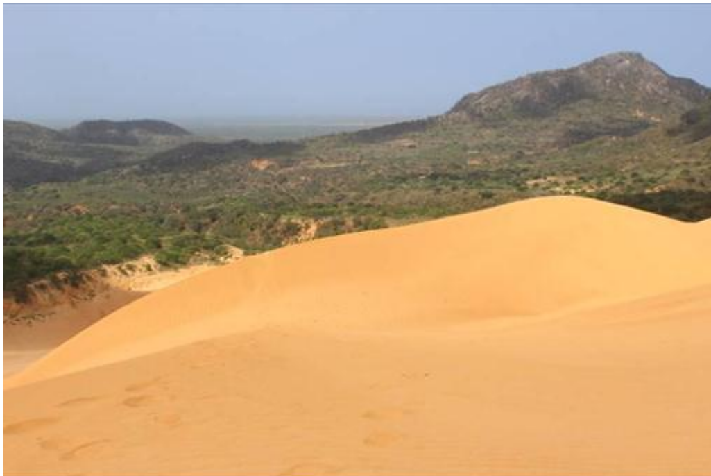
Médano de Aleworou