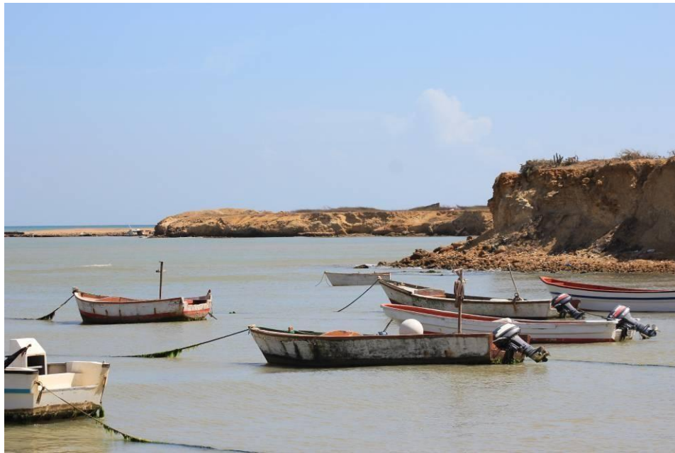
Playas en Puerto Estrella, zona amortiguadora