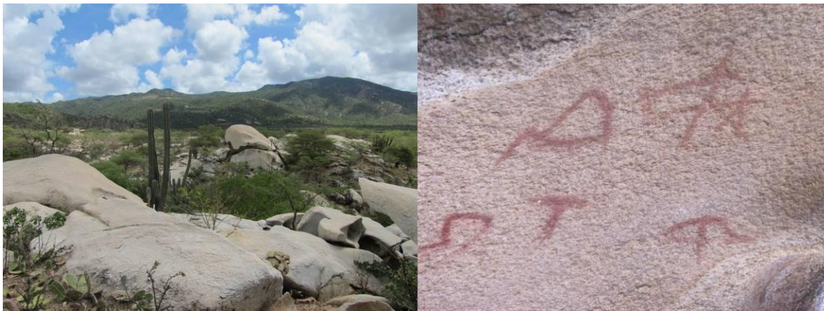
Sector Siapana; paisaje y pintura rupestre en Ipanarou