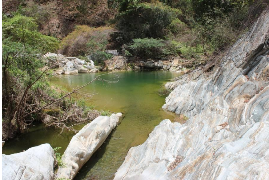
Batea de Kajashiwou