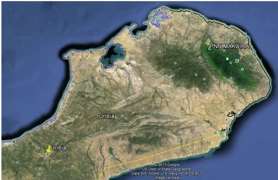
Imagen satelital de la Península de la Guajira

Localización general del Parque Natural Nacional de Macuira.