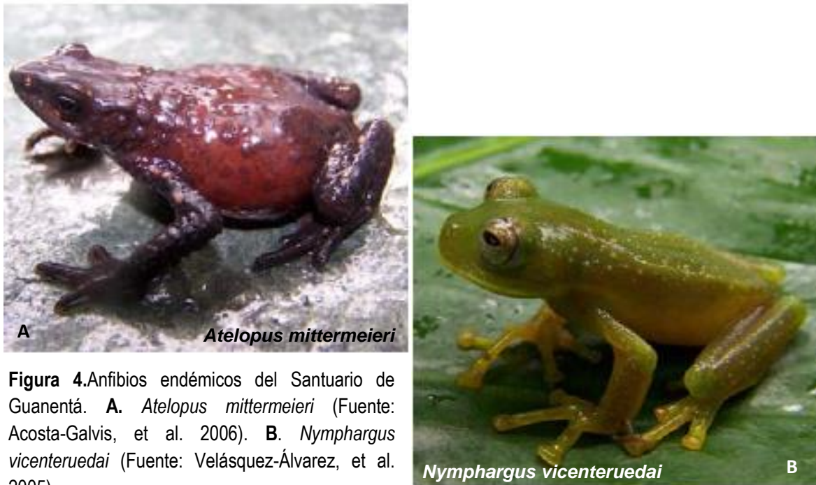
Figura 4. Anfibios endémicos del Santuario de Guanentá. A. Atelopus mittermeieri (Fuente: Acosta-Galvis, et al. 2006). B. Nymphargus vicenteruedai (Fuente: Velásquez-Álvarez, et al. 2005).

Dentro de la jurisdicción del Santuario, los grupos faunísticos mejor estudiados son anfibios y aves. Para el primer grupo, se han registrado 33 especies, de las cuales tres son endémicas: Atelopus mittermeieri , Eleutherodactylus carlossanchezi y Nymphargus vicenteruedai .