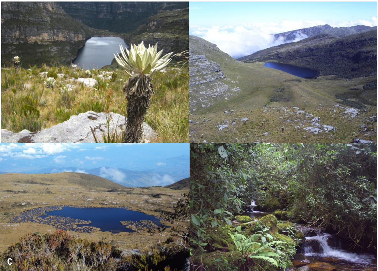
Figura 3. Sistema hídrico del SFF Guanentá-Alto Río Fonce. A. Laguna de Cachalú, B. Laguna de Agua Clara, C. Laguna Los Cuadros y D. Quebrada Chontales.

El sistema hídrico del Santuario de Guanentá, incluye tres lagunas de alta montaña: Cachalú, Agua Clara y Los cuadros; además, de las quebradas California, Chamizal, El Cedro, Cachalú, La Venada, entre otras, y los ríos La Rusia, Guillermo y Negro, que nacen en el páramo de la Rusia. Todas las aguas producidas al interior del área protegida, tributan finalmente en el río Suárez a través de dos afluentes principales: Fonce y Oibita.