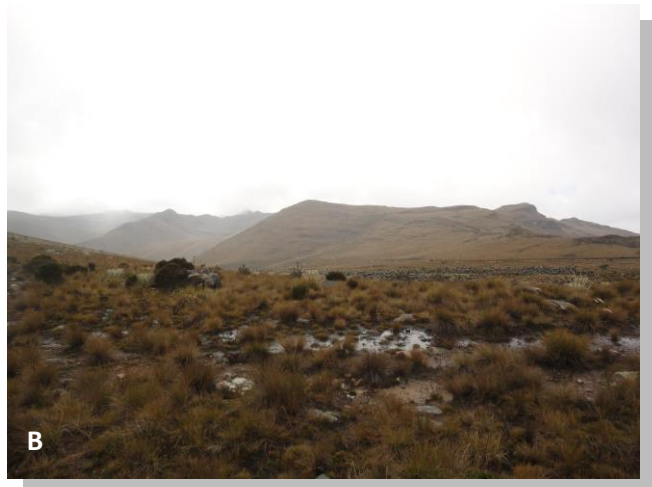
Figura 2. Clima en los ecosistemas del Santuario de Guanentá. A. Bosque andino, B. Páramo.

La otra unidad, es muy húmeda y se caracteriza por ser una pequeña porción localizada al sur de la anterior unidad, sobre el páramo de La Rusia. El total anual de evapotranspiración potencial es algo menor de los 700 mm y presenta un rango altitudinal que va de los 3300 a 3600 msnm.