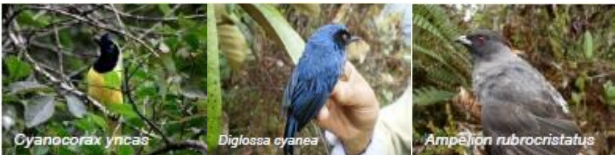
Figura 5. Aves del Santuario de Guanentá.

Se han registrado 170 especies de aves distribuidas en 37 familias y 11 órdenes.