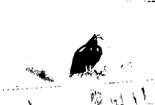
Guala Sabanera ( Cathartes burrovianus ).

Dentro del predio hay una presencia importante de fauna representativa de la Orinoquia, que incluyen especies en peligro de extinción como el puma o león americano ( Puma concolor ), el ocarro ( Priodontes maximus ); así mismo se han observado ejemplares de jaguar o tigre americano ( Panthera onca ) y danta o tapir ( Tapirus terrestris ) los mismos reportados para otros predios. En los cursos de agua se destaca la presencia de grupos de perros de agua ( Pteronura brasiliensis ), toninas ( Inia geoffrensis ), caimán del Orinoco ( Crocodylus intermedius ), babillas ( Caiman crocodilus ) y abundancia de peces como el pabon, cachama, bagres y curito. Otras especies reportadas son el venado ( Odocoileus virginianus ), boruga o lapa ( Cuniculus paca ), cachicamo ( Dasypus novemcinctus ), mono araguato o aullador ( Alluato seniculus ) y el mono capuchino ( Cebus sp ) entre otros. Más que la riqueza de especies, la biodiversidad de la región se caracteriza por su gran heterogeneidad de ecosistemas y grandes concentraciones de algunas especies como fenómeno sobresaliente, aun cuando no único.