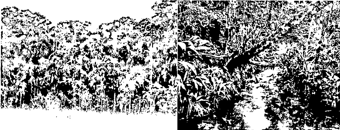
Bosque de galería.

La zona de conservación del predio el Trikuti comprende un área de 259 hectáreas y 8363 metros cuadrados; la propietaria destino como zona de conservación el terreno que comprende 500 metros por la riera del Río Tomo, 300 metros del borde de cada caño que forma lindero y que desembocan en el río Tomo, sumando el caño que está en medio de ellos, que igual, converge al Río Tomo. Esto abarcaría zonas en las que se encuentran demarcadas por estudios de investigación realizados por biólogos de la Universidad de los Andes, igualmente una sabana rodeada totalmente de bosque, ubicada en la esquina sur oriental del predio.