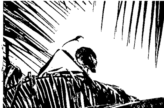
Coclí ( Theristicus caudatus ).

En la Altillanura sus ondulaciones son tan suaves que facilitan el desplazamiento por medio terrestres, lo que ha sido aceptado como un argumento de fácil mecanización. Pero su textura y organización estructural advierten sobre grandes riesgos erosivos por la utilización de elementos de labranza tradicionales: rastras, rastrillos y arados de discos, lo cual hace que para su mecanización deban considerarse precauciones especiales tanto en el laboreo como en la formulación de fertilizantes. El potencial productivo de estos suelos está en relación directa con la planeación de su laboreo y los subsiguientes sistemas de producción los cuales deben ser consecutivamente complementarios desde pasturas hasta cultivos transitorios y perennes, entendidos como fases de un proceso de construcción de suelo.