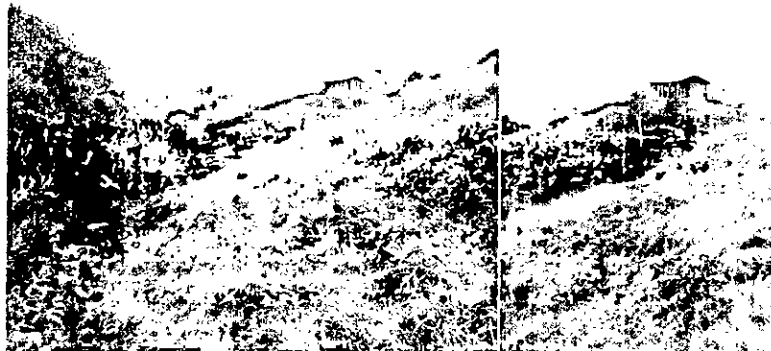
Imagen 3. Izquierda: Límite con predios continuos. Derecha: Casa del predio El Diviso.

En la parte alta de una montaña se encuentra ubicada la casa en donde reside el propietario del predio, como única construcción existente, no cuenta con servicios públicos de luz ni alcantarillado. La casa esta subdividida en una habitación y una cocina (la estufa es de leña) (Imagen 3).