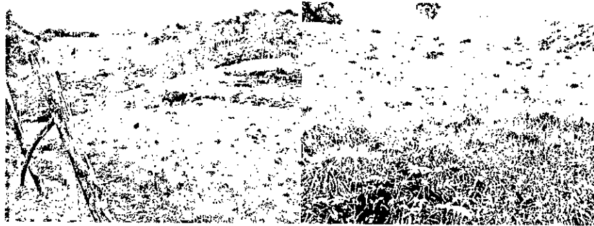
Imagen 1. Izquierda: Ganadería en el predio El Diviso. Derecha: Pastizales con árboles emergentes dispersos.

sietecueros, yarumos y palmas (Imagen 1). La fauna es escasa, tan solo se observaron aves que prevalecen en zonas abiertas como el copetón ( Zonotrichia capensis ) y el chulo ( Coragyps atratus ) (Imagen 1).