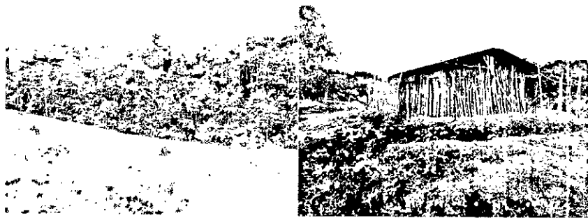
Imagen 2. Izquierda: Tocones de árboles. Derecha: Casa construida con madera y rodeada de leña.