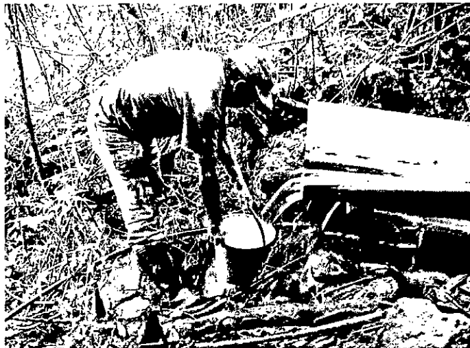
Foto 2. Aforo sobre la quebrada SIN NOMBRE