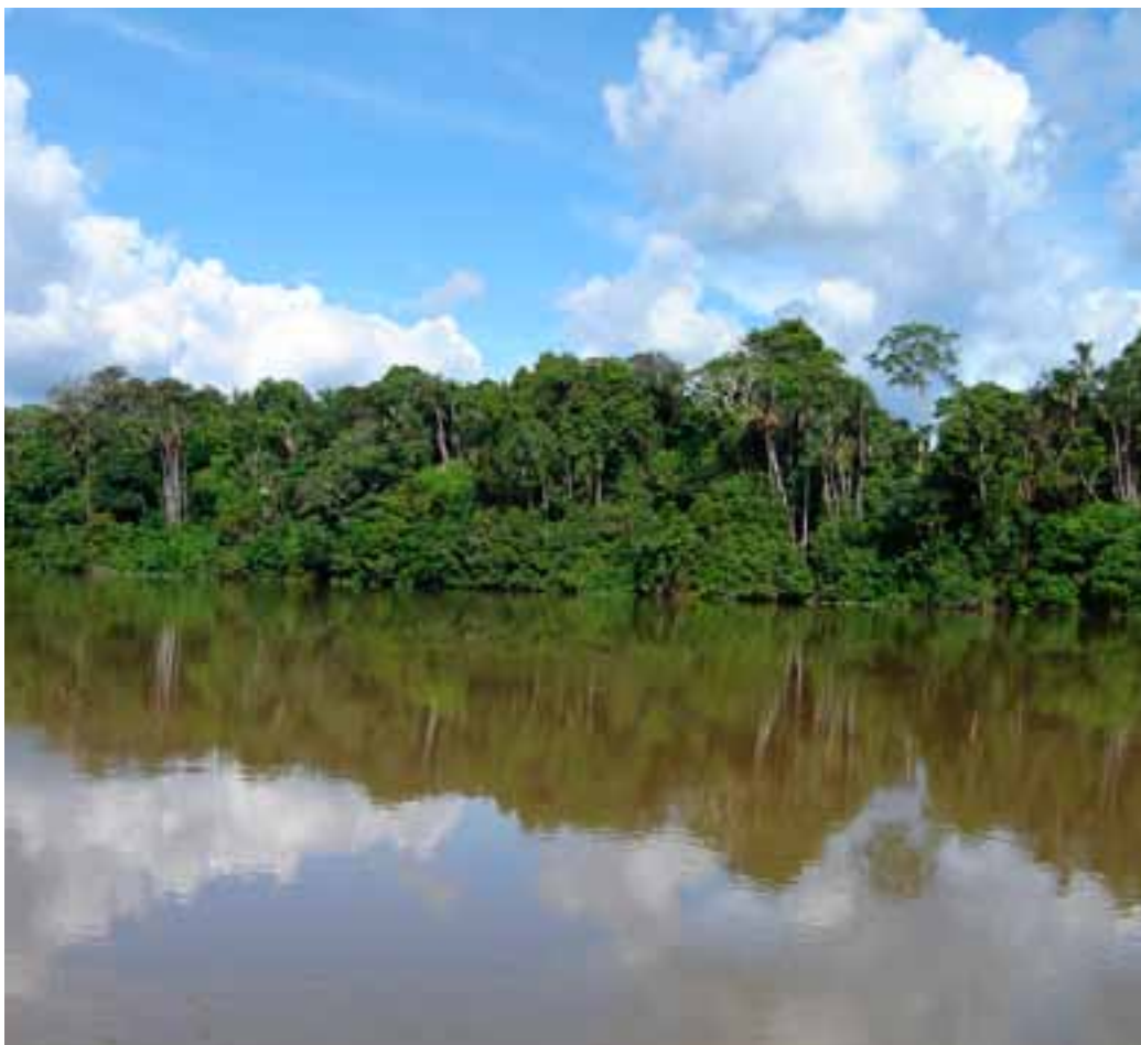
Parque Nacional Natural Cahuinari

Representantes del Ministerio Ambiente y Desarrollo Sostenible, del IGAC, INCODER, DANE, Superintendencia Notariado y Registro, Unidad de Planificación Rural y Agropecuaria – UPRA y Parques Nacionales Naturales, se reunieron el pasado 4 de noviembre de 2014 con el objetivo de reafirmar los compromisos y corresponsabilidades institucionales frente a la problemática de uso, tenencia y ocupación de las áreas del Sistema de Parques Nacionales en el marco de la construcción de escenarios de paz para el posconflicto.