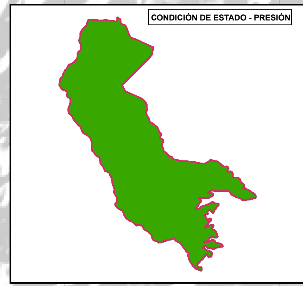
ESTADÍSTICAS DE CAMBIO