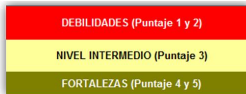
Imagen 2: Rango de Valores para Priorizar las Necesidades y Fortalezas de Manejo de AP (AEMAPPS 2013).