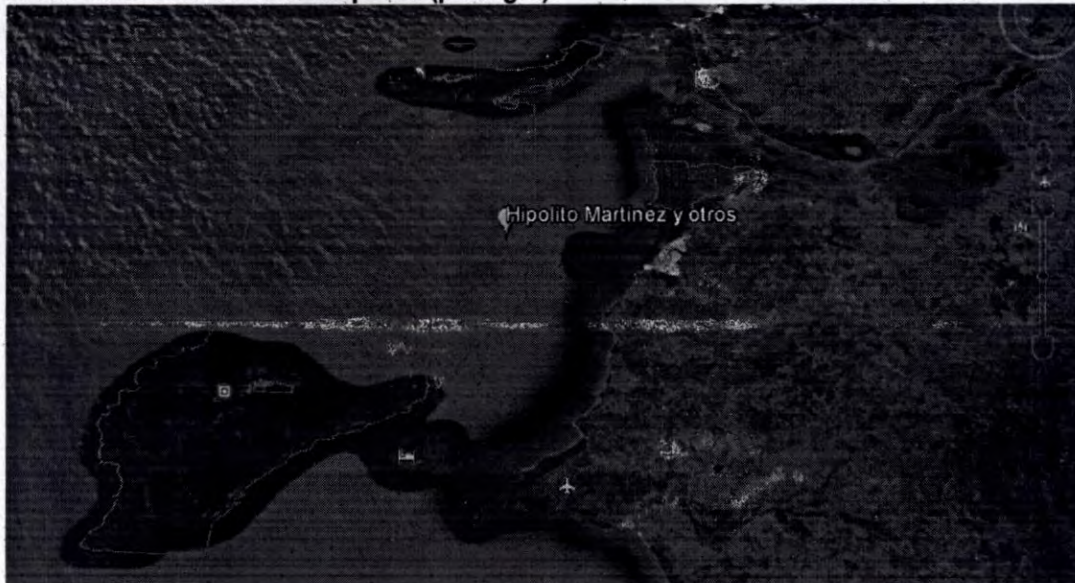
Figura 1. Límite del Parque Nacional Natural Corales del Rosario y San Bernardo, punto donde se encontró el arte de pesca (palangre).

De acuerdo al artículo 331 del Código Nacional de Recursos Naturales Renovables y de Protección al Medio Ambiente (Decreto Ley 2811 de 1974), las actividades permitidas en los Parques Nacionales Naturales son las de conservación, recuperación, control, investigación, educación, recreación y cultura.