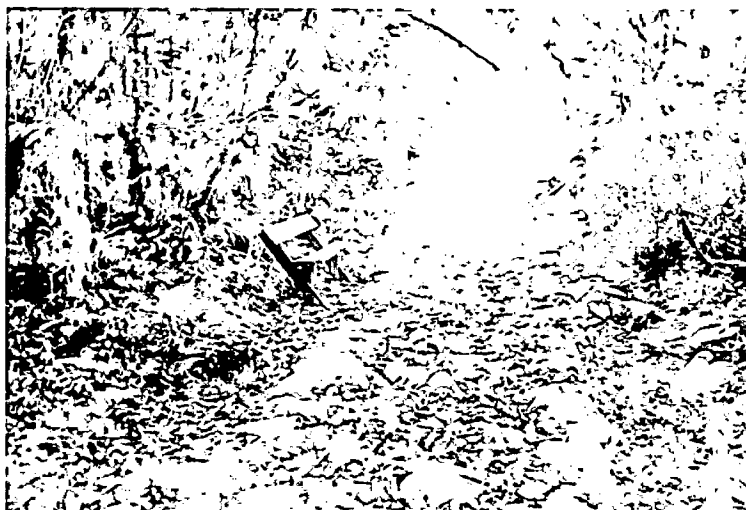
Fig. 2. Sitio de descanso para quienes visitan el histórico camino de Lenguerke, en el predio Reserva de las aves Reinita Cerúlea.

Zona de conservación: Para la zona de conservación se determina un área de 39.0208 ha. La zona de conservación de la reserva Reinita Cerúlea corresponde a bosques muy húmedos premontanos ubicados entre 1600 y 1800 m.a., en un buen estado de conservación, dominados por elementos arbóreos y subarbóreos.