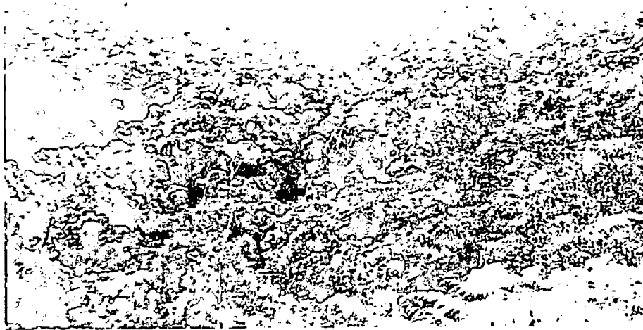
Fig. 1. Coberturas naturales de la zona de conservación del predio Reserva de las aves Reinita Cerúlea.

Con respecto a la zona de amortiguación y manejo especial es dominada por estratos arbustivos y subarbóreos de las familias Rubiaceae, Melastomataceae, Piperaceae, Cecropiaceae, Asteraceae, entre otras, con algunos elementos arbóreos, con una baja abundancia de musgos, hepáticas, antoceros y bromeliáceas epífitas.