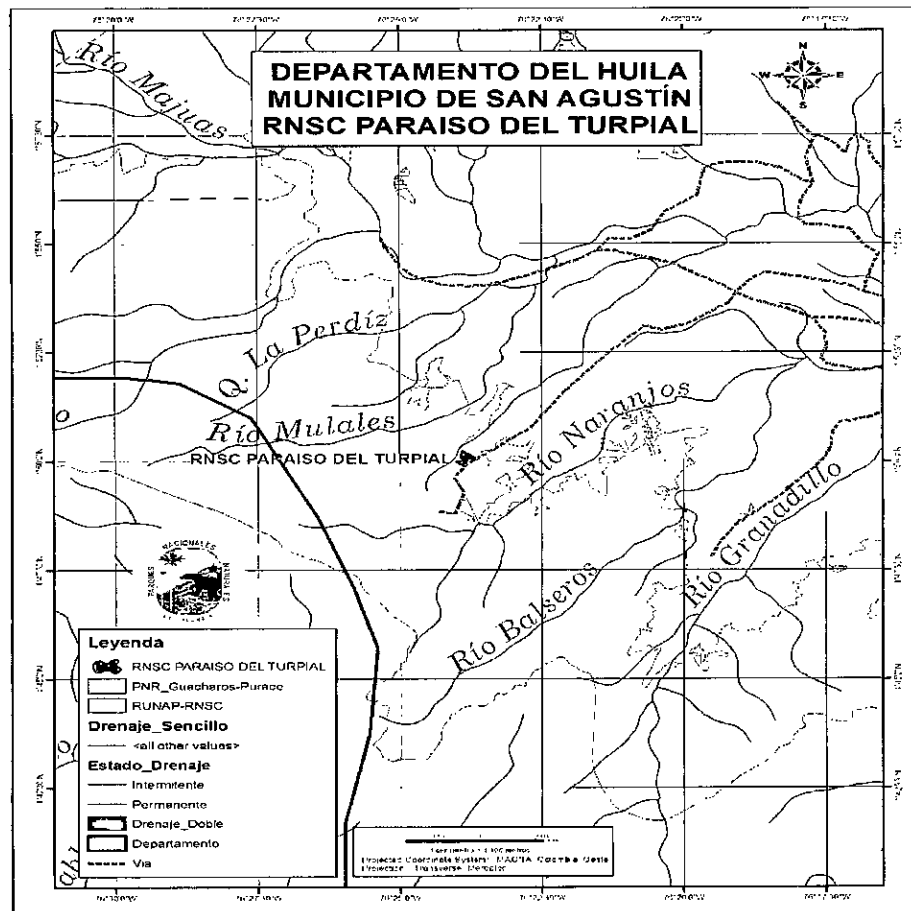
Mapa de contexto1

Los Linderos la Reserva El Paraíso del Turpial están contenidos en sentencia sin número de fecha 29-05-2007 en Juzgado Primero Civil del circuito de Pitalito y registrados en el folio de matrícula Inmobiliaria ya anotado anteriormente.