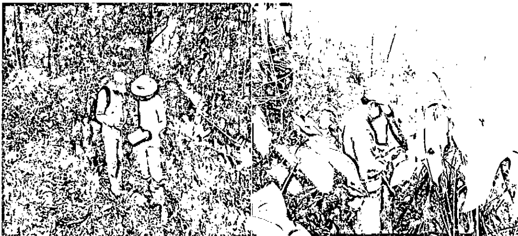
Bosque Andino RNSC Iguakán.

Conforme a lo observado durante la visita al predio y lo que se encuentra en la reseña descriptiva 2 presentada junto con la solicitud de registro, se encuentra una porción de bosque de roble en muy buenas condiciones ( Quercus humboldtii ) que alcanzan alturas entre los 18 y 20 m, especie que predomina en la zona, también una gran variedad de bromelias o Quiches ( Tillandsia sp), Anturios (familia Araceae) y orquídeas (familia Orchidaceae). También se encuentran árboles de Quina ( Ladenbergia macrocarpa ), Aguacos ( Cyathea pallezens ), helechos arbóreos de hasta 7 metros de altura ( Clusia inesiana ), Gaque de hasta 10 m de altura y varias especies de arrayanes (Familia Myrtaceae).