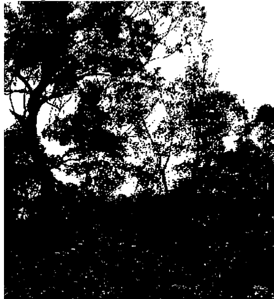
Imagen No. 1: Bosque presente en la reserva.

El bosque comprende un grado muy bajo de epifitas, con algunas Bromelias ( Tillandsia cf. fendleri , Tillandsia compacta , y Tillandsia pastensis ). Orquídeas ( Comparettia macroplectron ) y Piperaceas ( Peperomia galioides ). El resto del predio presenta pequeños potreros con especies de pastos como, Anthoxanthum odoratum y Holcus lanatus (Poaceae), además de otras especies arbustivas y herbáceas asociadas como, Lantana cámara (Verbenaceae), Pteridium arachnoideum (Dennstaedtiaceae), Rhynchospora sp. (Cyperaceae) y Rubus glaucus (Rosaceae) de las cuales son que componen estas áreas. También lugares dedicados a cultivos mixtos de banano ( Musa paradisiaca ) y café ( Coffee arabica ); estos sitios están enriquecidos con algunos árboles plantados como Alisos ( Alnus acuminata ), Chochos ( Erythrina edulis y Erythrina rubrinervia ), Eucaliptos ( Eucalyptus camaldulensis y Eucalyptus pulverulenta ), Urapanes ( Fraxinus uhdei ), Cedros ( Juglans neotropica ), Guayacanes de Manizales ( Lafoesia acuminata ) y Robles ( Quercus humboldtii ) (...). (Folio 41)