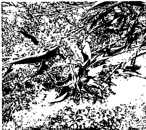
Imagen No. 4: Quiche (Familia Bromeliaceae).