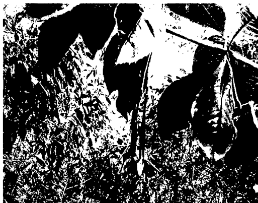
Imagen No. 1: Fucsia ( Fuchsia sp)