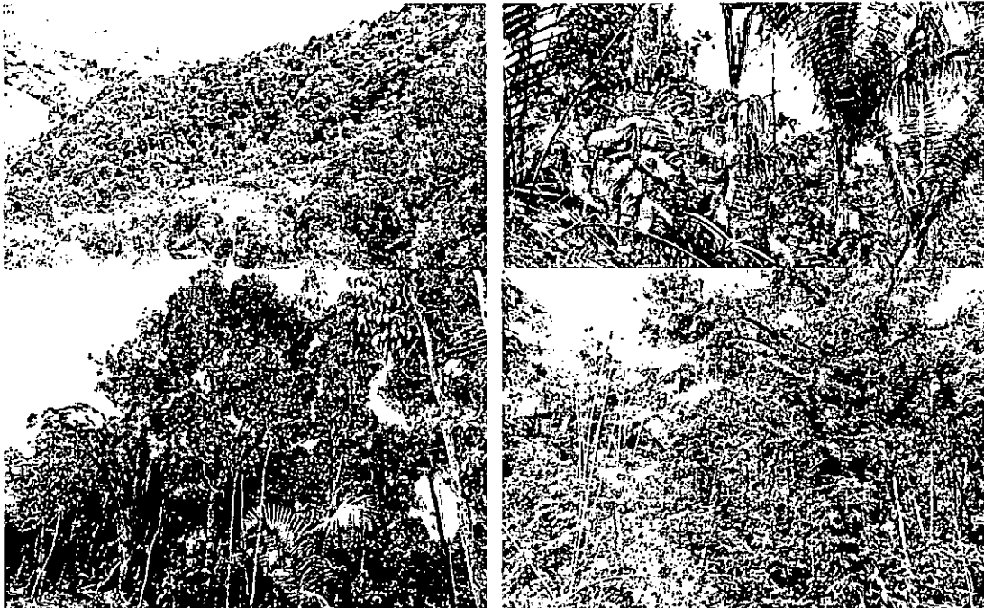
Figura 2. Zona de conservación RNSC La Galicia

La ubicación de la Reserva le permite aportar en la generación de corredores de conectividad entre bosques de predios vecinos, que a su vez se conectan con La Cuchilla Villalobos, área que en el momento no posee una figura de conservación Nacional ni Local, pero que tiene todo el potencial para serlo. A su vez hace conexión con los bosques del Distrito de Manejo Integrado Laguna de San Diego, ubicado al nordeste del predio, aportando a la conectividad biológica en la zona de influencia del Parque Nacional Natural Selva de Florencia.