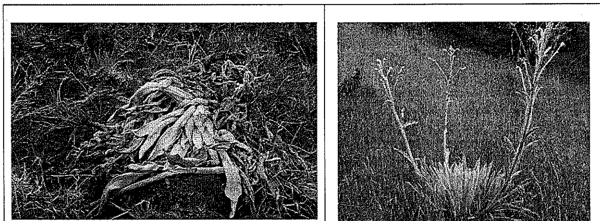
Detalle de Individuo de Espeletia tunjana muerto

En el terreno arado, se observan individuos muertos de la especie Espeletia tunjana ; otros individuos de la misma especie sobrevivieron, probablemente porque la labranza del terreno estaba inacabada cuando se interrumpió la labor