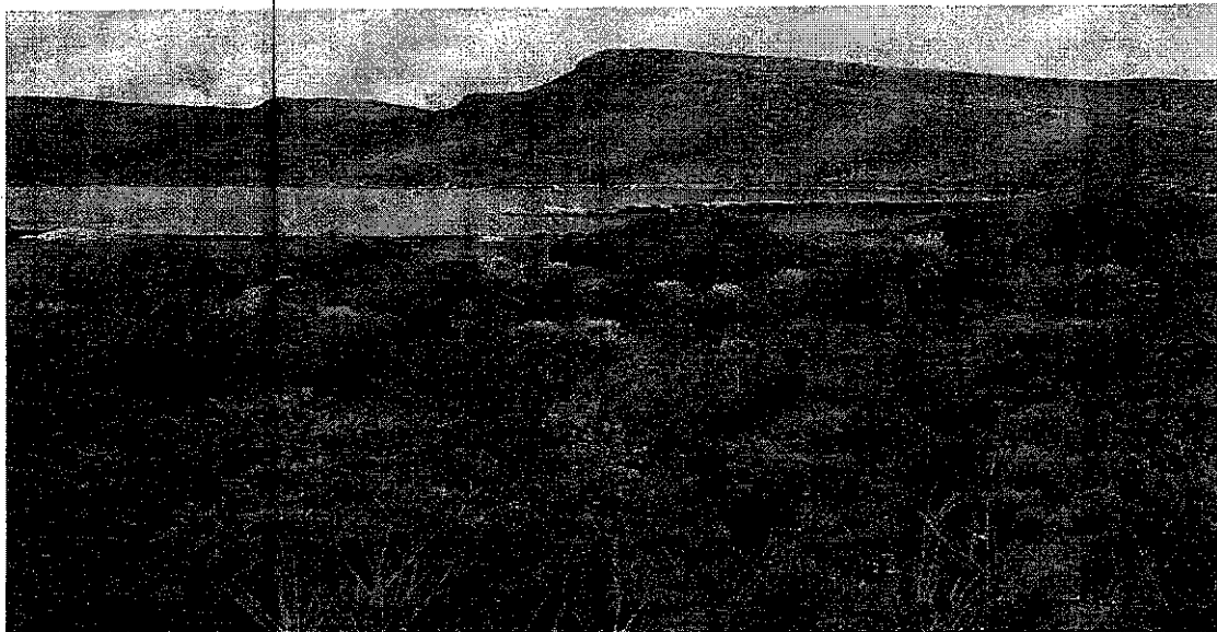
Foto 6. Vegetación presente en el área afectada, entre la laguna de Chisacá y la vía Troncal Bolivariana. (...)"