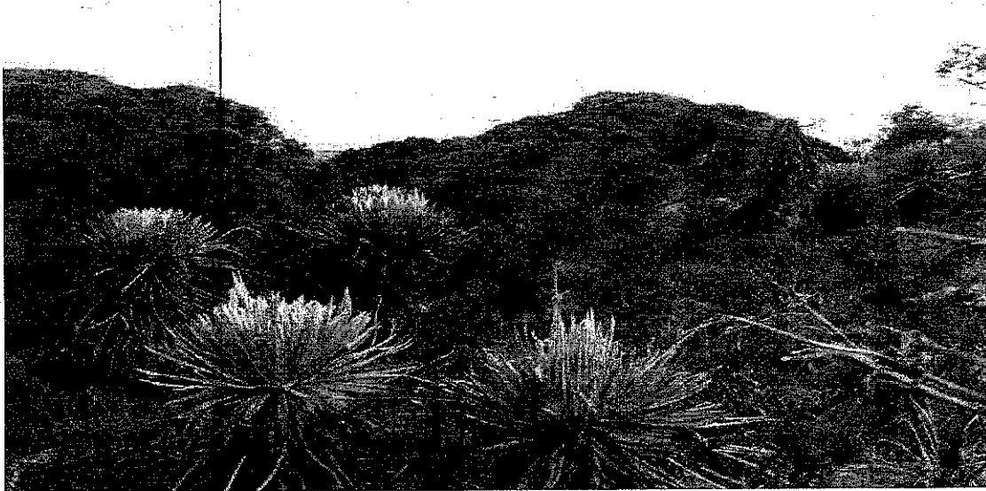
Foto 5. Matorral de Romero de Páramo, localizado entre la laguna de Chiascá y la vía Troncal Bolivariana, afectado por la presunta infracción.

Foto 4. Especie vegetal afectada por extracción de flora del PNN Sumapaz. Romero de Páramo ( Diplostegium revolutum ).