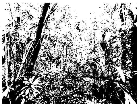
Foto 3. Bosque de ladera