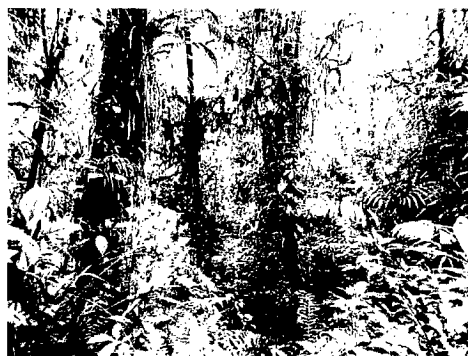
Foto 2. Bosque de zonas altas en el predio