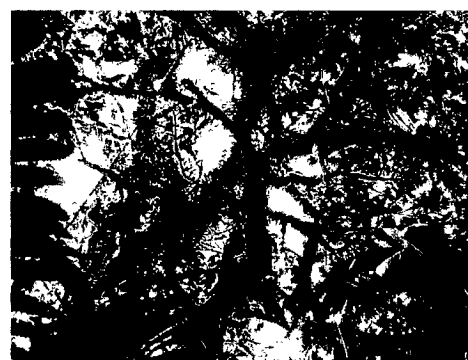
Foto 4. Dosel de bosque de zonas altas