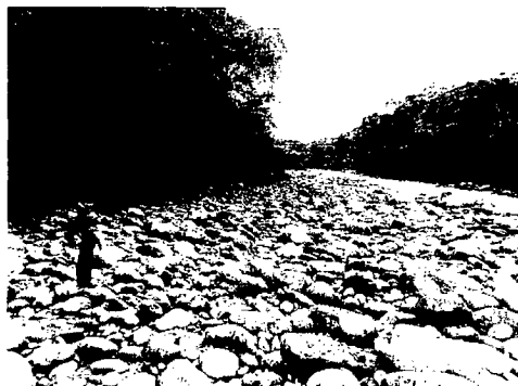
Foto 1. Rivera del Río Guamuez