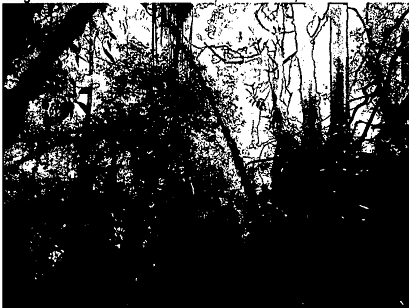
Imagen No. 1: Muestra de ecosistema presente en el predio "CUBARRAL".

El predio "CUBARRAL" posee una muestra de ecosistema que corresponde a: "Bosque Subandino", con especies arbóreas que alcanzan los 15 y 20 metros de altura cuyo sotobosque está compuesto por especies arbustivas y otros árboles en crecimiento. Posee una importante conectividad ecológica con bosques andinos vecinos, permitiendo el ingreso y protección de fauna de paso favoreciendo funciones ecosistémicas relacionadas con: la regulación del clima, la protección y regulación del recurso hídrico principalmente, la retención de nutrientes y la provisión de condiciones apropiadas para el desarrollo de poblaciones de especies de fauna y flora.