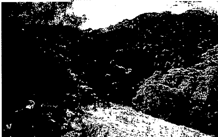
Imagen No. 4: RNSC "CUBARRAL".

4.2. ZONA DE AGROSISTEMAS: Esta zona corresponde a 1,0648 ha es decir el 49,77% del área objeto de registro; en esta zona está dedicada a las actividades de la ganadería en baja intensidad.