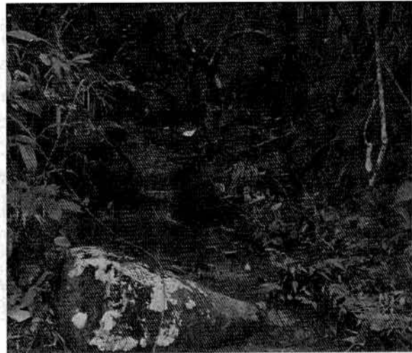
Imagen 4: Nacimiento de agua dentro el predio