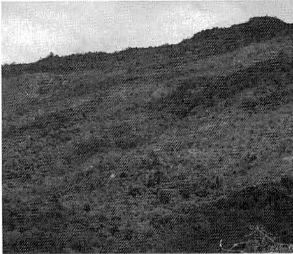
Imagen 3: Panorámica del bosque seco El Pedregal