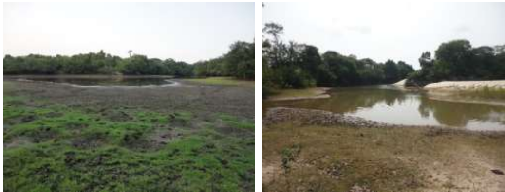
Zona de Conservación, Caño El Cariño y Calo Yatea RNSC VALLEDUPAR. Fuente visita técnica GTEA Abril 10 de 2019.

La Zona de Amortiguación y Manejo Especial está contigua a la Zona de Conservación, tiene una extensión de 10.4418 ha. es el área que bordea la zona de Conservación, la cual se encuentra conectada con el recorrido de los mismos a lo largo de los predios San Andrés y San Cristóbal. Esta zona, es un área de transición entre las sabanas y las corrientes de agua mencionadas, y sirve para el tránsito de los animales (ganado bovino y fauna silvestre) en su paso hacia los caños en la temporada de verano, cuando el agua es escasa en la sabana. Esta zona de transición es vital para las especies silvestres, así como para las actividades agropecuarias del predio; es además, la franja de protección para la Zona de Conservación.