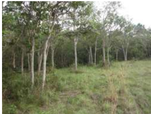
Zona de amortiguación aledaña a la zona de Conservación. RNSC VALLEDUPAR.