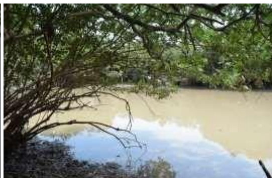
Figura 2. Madrevieja asociada al caño Duya