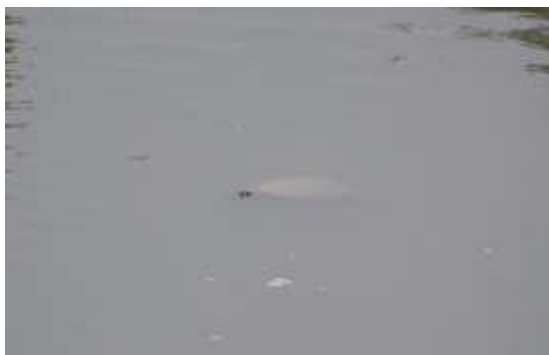
Figura 1 3 . Tortuga terecay ( Podocnemis unifilis )