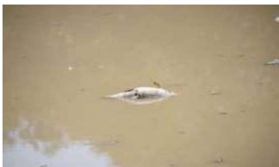
Figura 3. Ejemplar de guabina ( Hoplias malabaricus ) muerto