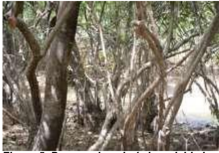
Figura 5. Bosque de galería inundable basal