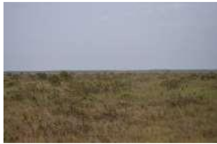
Figura 7. Sabanas naturales donde se desarrolla la ganadería extensiva