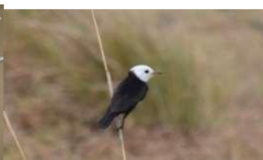
Figura 4. Viudita ( Arundinicola leucocephala )