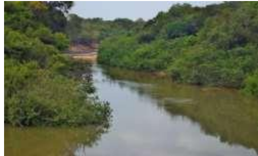
Figura 6. Caño Duya