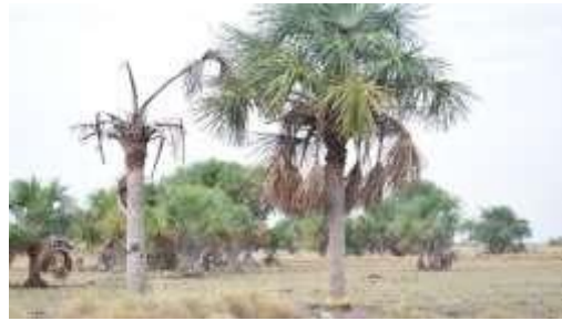
Figura 8. Sabanas inundables con presencia de palma de moriche ( Mauritia flexuosa )