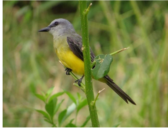
Fotografías 3 y 4 Aves presentes en la RNSC LA FLORESTA (Fuente: Concepto Técnico 2020603000026 del 08/07/2020)