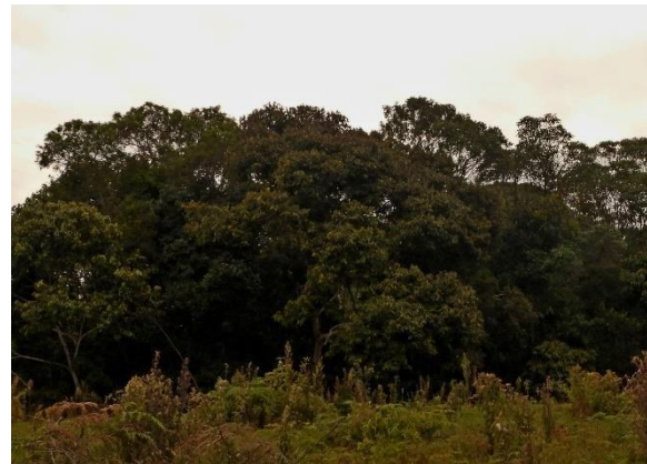
Fotografía 1 y 2. Flora de La RNSC LA FLORESTA (Fuente: Concepto Técnico DTAO No. 20206030000026 del 08/07/2020)