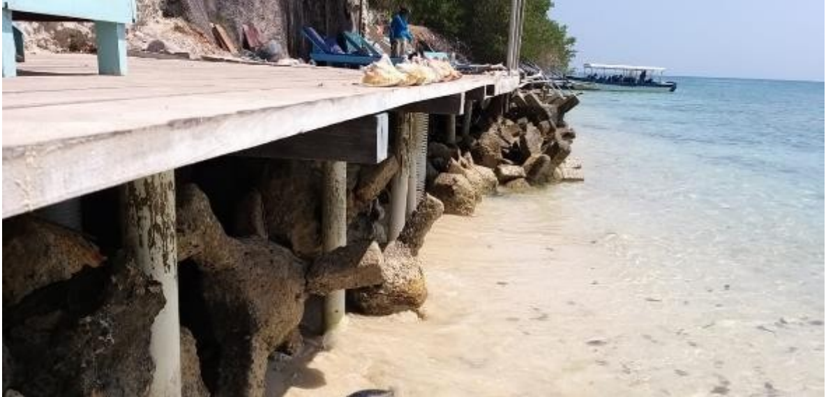
Fotografía 7. Registro de línea de hexápodos por debajo de plataforma como barrera de protección costera combinada con piedra coralina a forma de relleno.