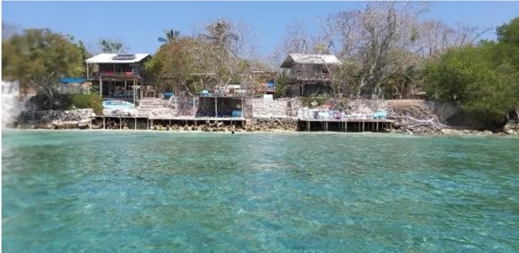
Fotografía 1. Vista panorámica de obras construidas en el "ecohotel El Hamaquero".