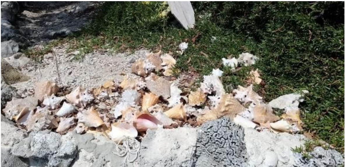
Fotografía 8. Zona de relleno con cabezas de coral y acumulación de conchas de caracol pala de diferentes tamaños