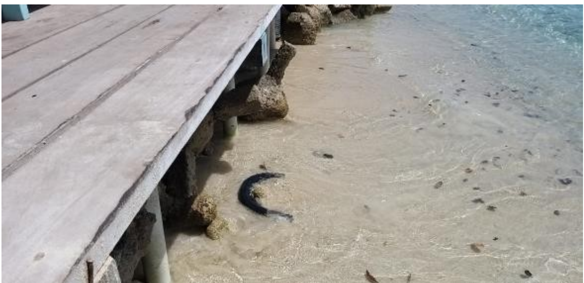
Fotografía 6. Afectación sobre litoral arenoso y fauna asociada producto del registro de neumáticos propiciando la contaminación por microplásticos