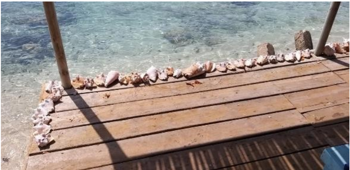
Fotografía 5. Plataforma en madera con acumulación de conchas de caracol ( Lobatus gigas y Cassis sp.). El registro de los moluscos se presentó en múltiples lugares del predio.