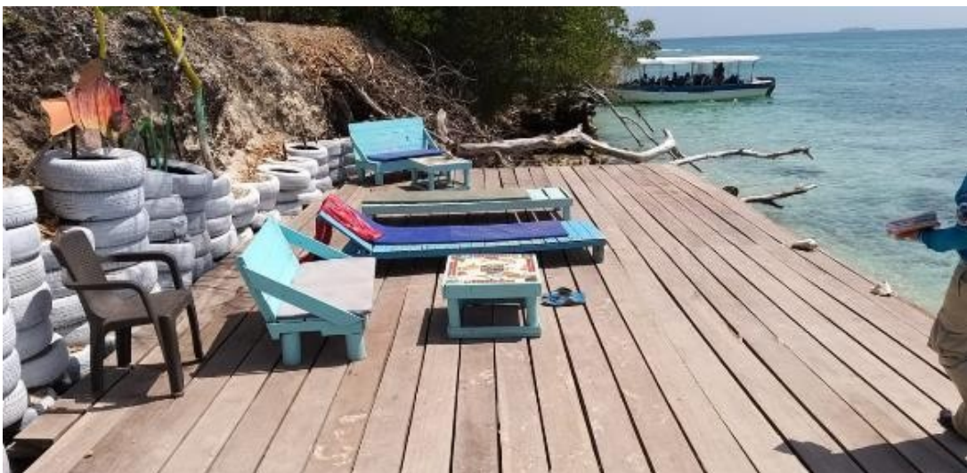
Fotografía 2. Vista superior de plataforma en madera construida sobre el litoral arenoso