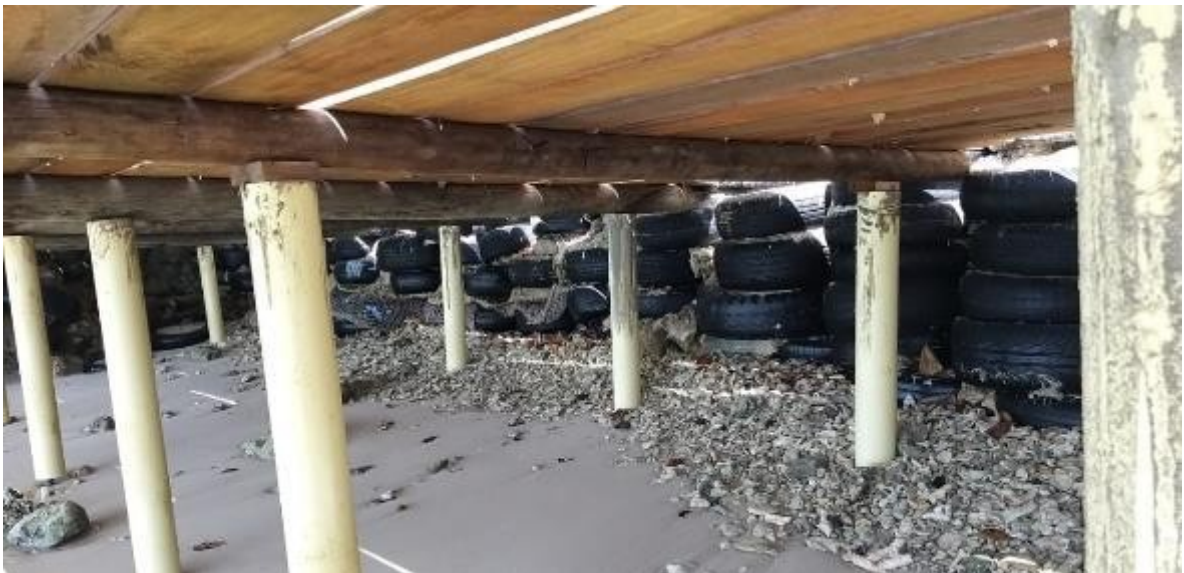
Fotografía 3. Vista inferior de plataforma en la cual se evidencia el uso de pilotes en tubos de PVC con cemento sobre la zona sumergida y la barrera de contención con neumáticos.