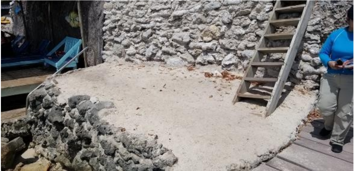
Fotografía 4. Relleno realizado con piedra coralina, cemento y arena entre las dos plataformas construidas.