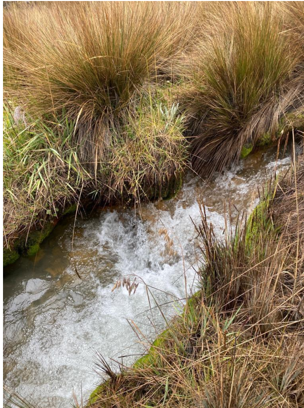
Ilustración 1. canalización artesanal Q. Alfómbrales

En el sitio de captación propuesto existe una captación por medio de una canalización que se realizó por medio de una acequia artesanal reforzado en algunos puntos con costales de arena sobre la quebrada Alfómbrales, este canal se encuentra ubicado a un costado del humedal Alfómbrales. En el sitio de la captación no existe ninguna infraestructura construida, la captación consiste en la canalización la cual tiene unas dimensiones aproximadas de 40 cm de ancho y recorre una distancia de casi 5 km.