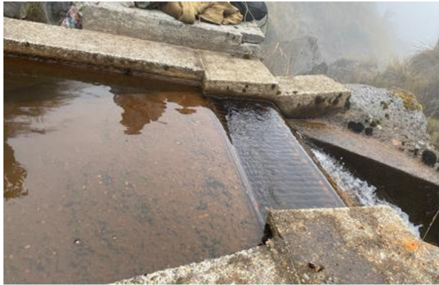
Ilustración 1. Bocatoma de Fondo