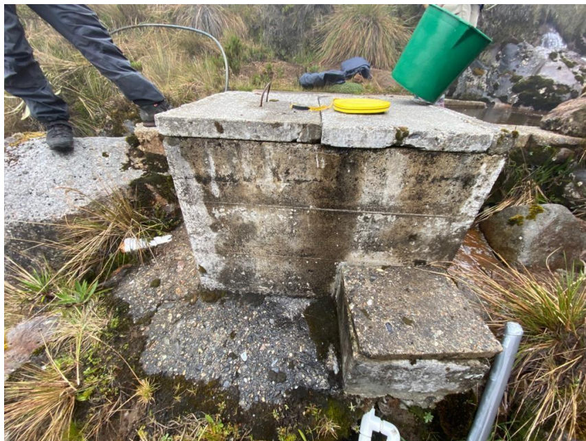
Ilustración 2. Tanque Desarenador

El tanque de almacenamiento es una estructura circular de cemento con un diámetro aproximado de cinco (5) metros y 5 metros de profundidad, del cual se deriva una manguera de \frac{3}{4} ”.