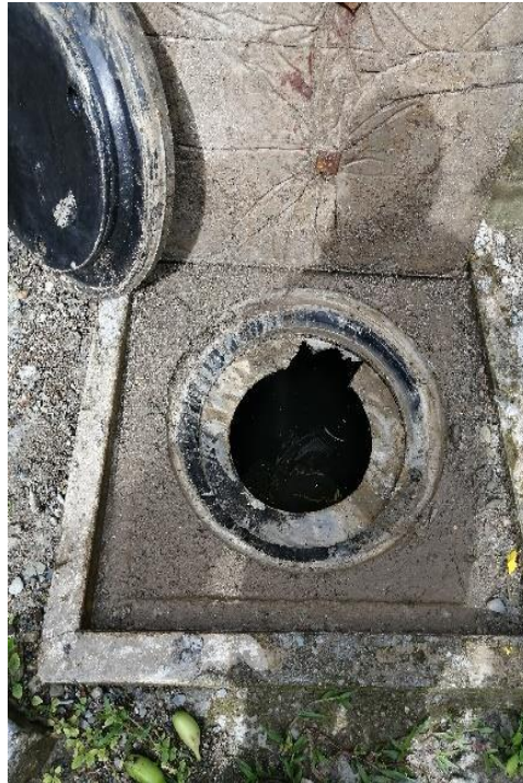
Foto 1. Sistema Séptico Sawerman