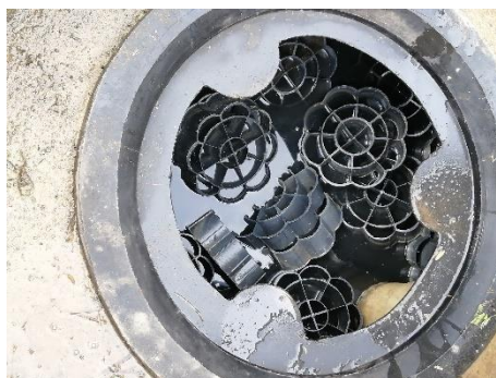
Foto 2. Material filtrante

El Sistema cuenta con un tanque Filtro Anaerobio de Flujo Ascendente de capacidad 2000 litros y recibe las aguas de los pozos sépticos, este elemento permite una remoción mayor de las cargas contaminantes del agua residual.