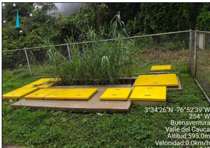
Foto 1. Sistema Séptico Oficina Automotriz No. 1

El Sistema de Tratamiento cuenta con 1 tanque séptico con capacidad de 4000 litros, uno recoge las aguas residuales de las oficinas administrativas, gimnasio, antigua escuela y oficinas taller automotriz.