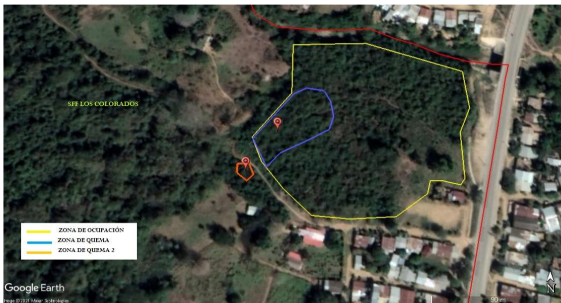
“Figura 1: Zona intervenida por ocupación ilegal al interior del SFF Los Colorados, con actividades de quema, la línea roja corresponde al límite del área protegida.”

Ante dicha situación, en una visita posterior realizada el día 30 de marzo, se procedió a verificar la coordenada del sitio intervenido, la cual corresponde a N 09°57' 6.82" y O 075° 05' 19.7", que corresponde a un área aproximada de 0.025 hectáreas, en dicho sitio se encontró un letrero en cartón con el nombre Rafael Tapias y un número de celular 3127893326 , el cual, podría estar relacionado con la división o loteo que realizaron ante la ocupación ilegal. Evidenciándose de igual manera, una segunda zona intervenida en las coordenadas N 09°57' 5.85" y W 075° 05' 20.42", con un área de 0.004 hectáreas (Figura 1).”