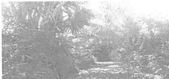
Figura 2. Zona de Conservación 2 alrededor del afluente