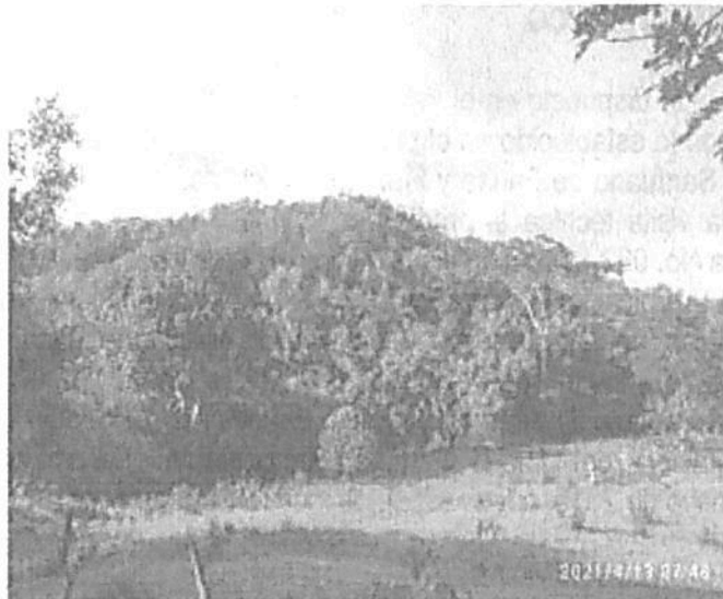
Figura 1. Zona de Conservación 1

Durante la visita, se pudo observar además especies faunísticas tales como: titi cabeciblanco ( saguinus oedipus ), ardillas ( Sciurus sp ) y avifauna representativa de la región como guacharaca, ( Ortalis garrula ) tucán ( Ramphastos sulfuratus ), entre otros.