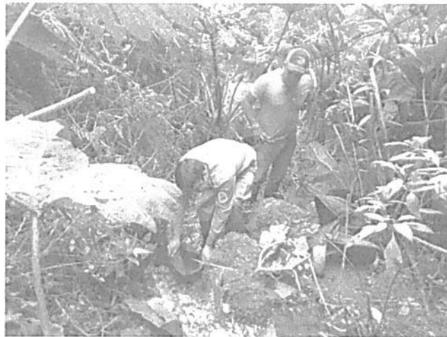
Punto de captación Quebrada El Pailón