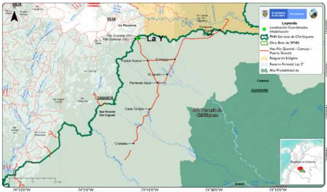
Localización de coordenada para Inhabilitación de vía y el PNN Serranía de Chiribiquete