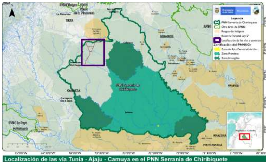
Mapa 1. Localización de la vía Tunia - Ajaju - Camuya y Zonificación del PNN Serranía de Chiribiquete

Al occidente del PNNSch en el municipio de San Vicente del Caguán se detectó un conjunto de vías y caminos con un total de 113,7 Km que fragmentan la cabecera de los ríos Ajaju y Yaya – Ayaya en la subzona hidrográfica del río Ajaju y los bosques basales e inundables del Zonobioma Húmedo Tropical y Helobioma Yari-Chiribiquete. Al facilitar el acceso este conjunto de vías es motor de la deforestación en este sector del área protegida en lo que denominamos el Núcleo de Deforestación Tunia Ajaju (ver Mapa 3).