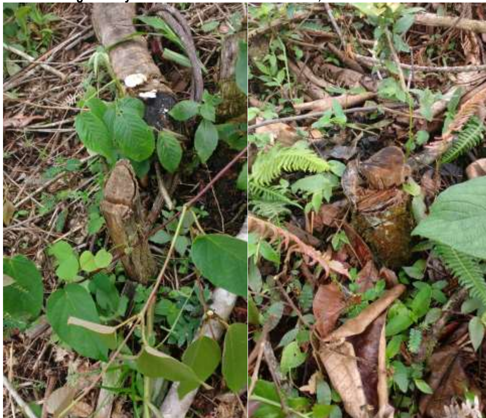
Tomadas del informe técnico inicial No. 20177660003836 del 5 de mayo de 2017.