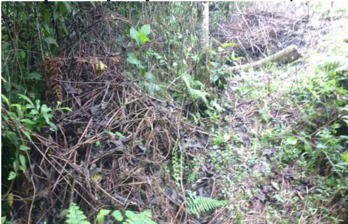
Imagen 4. Material vegetal seco generado con las actividades de rocería y socola

Tomada del informe técnico inicial No. 20177660003836 del 5 de mayo de 2017.