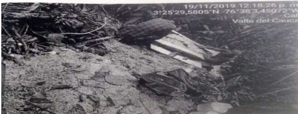
Tomada del informe de recorrido de campo del 19 de noviembre de 2019

Una vez se ha detallado la violación a la normatividad, a partir de las actividades concretas realizadas por el investigado, es necesario traer a colación el Plan de Manejo del PNN Farallones de Cali , según el cual, el predio donde se están cometiendo las presuntas infracciones se encuentra ubicado en Zona de Recuperación Natural definida en el Decreto 1076 de 2015, artículo 2.2.2.1.8.1., numeral 4 como: “Zona que ha sufrido alteraciones en su ambiente natural y que está destinada al logro de la recuperación de la naturaleza que allí existió o a obtener mediante mecanismos de restauración un estado deseado del ciclo de evolución ecológica; lograda la recuperación o el estado deseado esta zona será denominada de acuerdo con la categoría que le corresponda”.