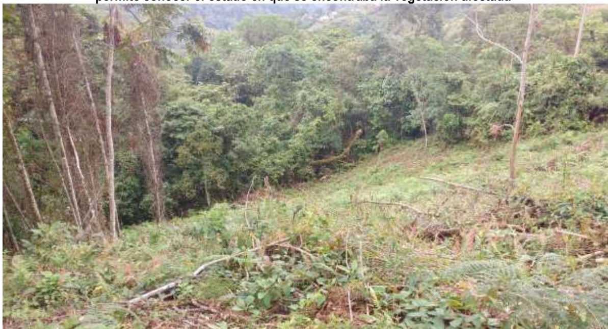
Imagen 2. Zona afectada por rocería y socola donde se evidencia la vegetación circundante que permite conocer el estado en que se encontraba la vegetación afectada

Tomada del informe técnico inicial No. 20177660003836 del 5 de mayo de 2017.