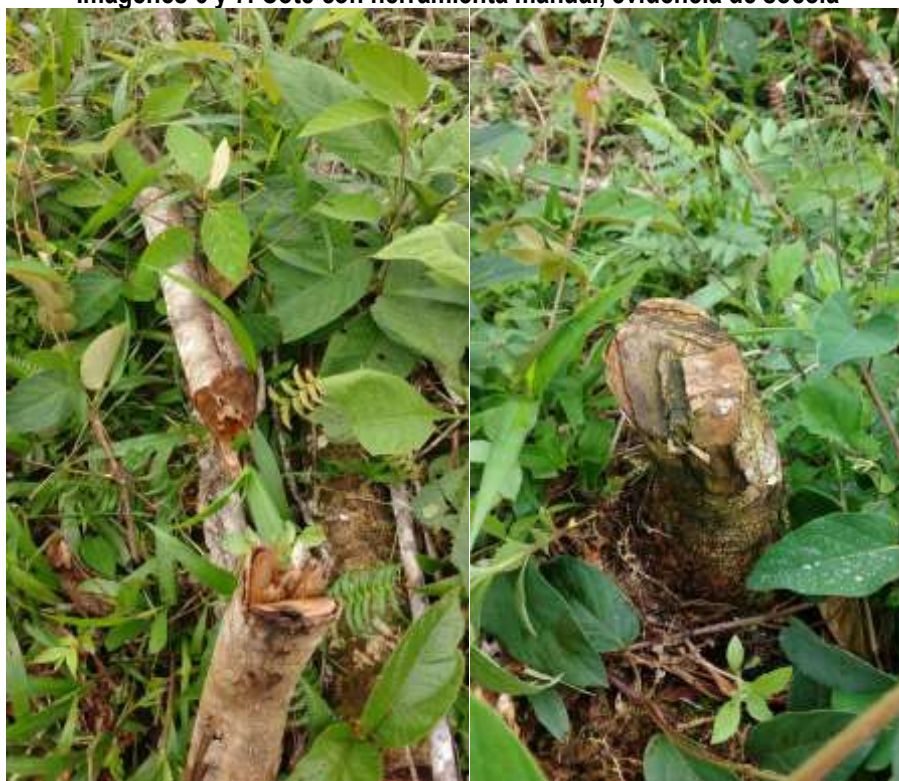
Tomadas del informe técnico inicial No. 20177660003836 del 5 de mayo de 2017.