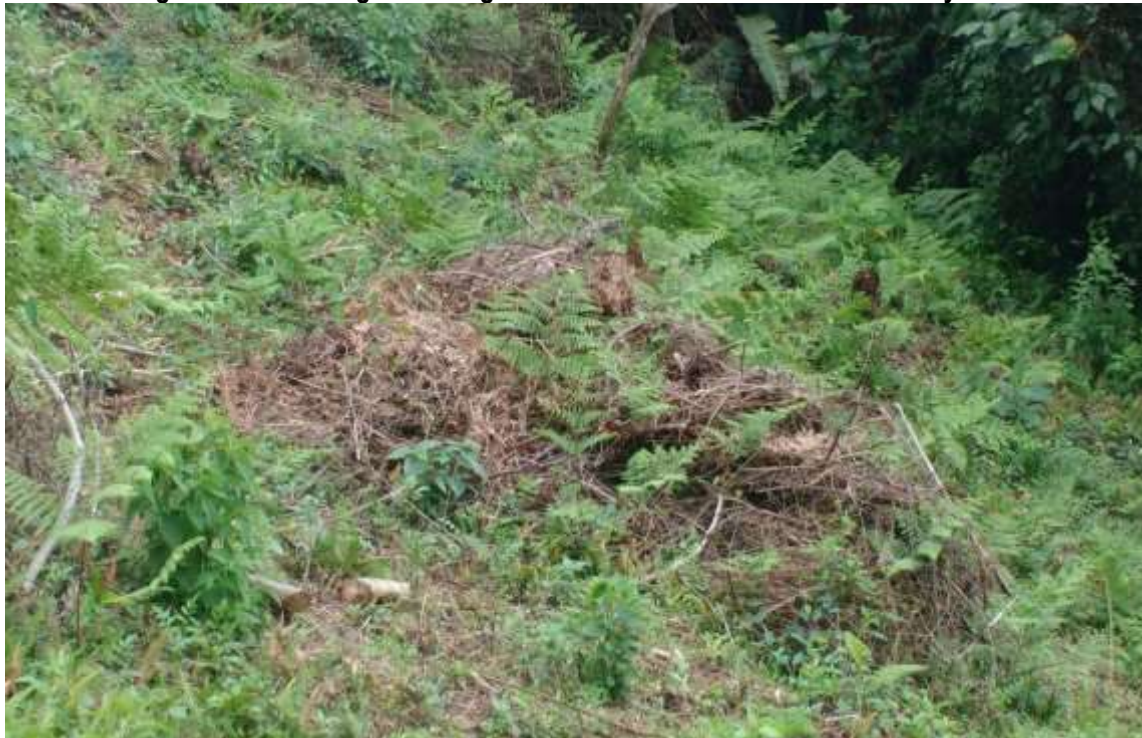
Imagen 3. Material vegetal seco generado con las actividades de rocería y socola