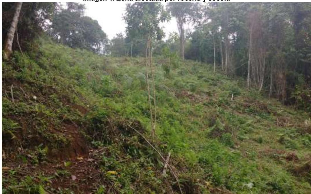
Imagen 1. Zona afectada por rocería y socola