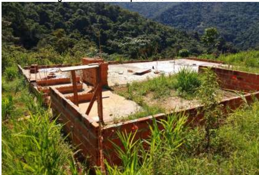
Imagen 1. Construcción parcial de infraestructura