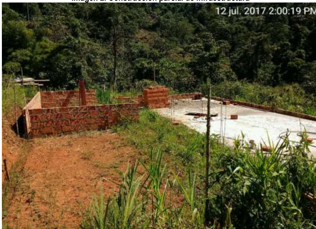
Imagen 2. Construcción parcial de infraestructura