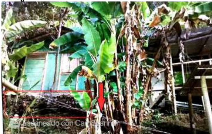
Imagen 3. Infraestructura No. 3 denominada cabaña No. 3

Tomada del Concepto Técnico No. 201576660000976, del 22 de abril de 2015