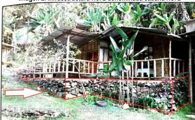
Imagen 2. Infraestructura No. 2 denominada cabaña No. 2