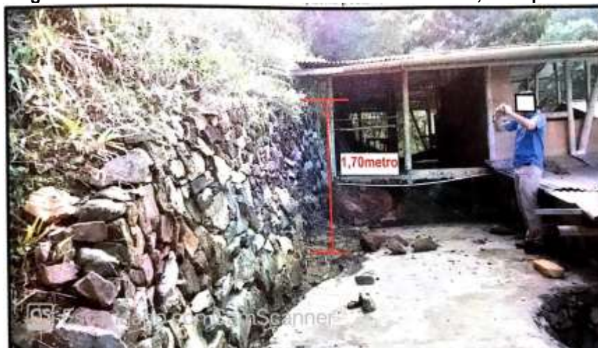
Imagen 6. Infraestructura No. 5 denominada cabaña No. 4, zona posterior

Tomada del Concepto Técnico No. 201576660000976, del 22 de abril de 2015