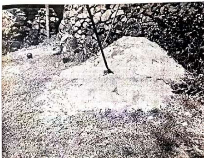
Imagen 13. Arena para construcción

Tomada del informe de recorrido de campo del 12 de junio de 2018.