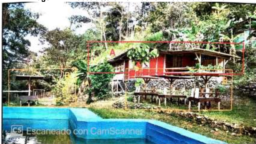
Imagen 1. Infraestructura No. 1 denominada Cabaña No.1

Tomada del Concepto Técnico No. 201576660000976, del 22 de abril de 2015