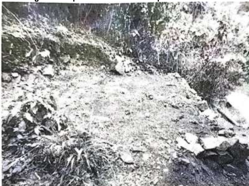
Imagen 12. Explanación de 2 metros por 4 metros cuadrados

Tomada del informe de recorrido de campo del día 1 de agosto de 2013