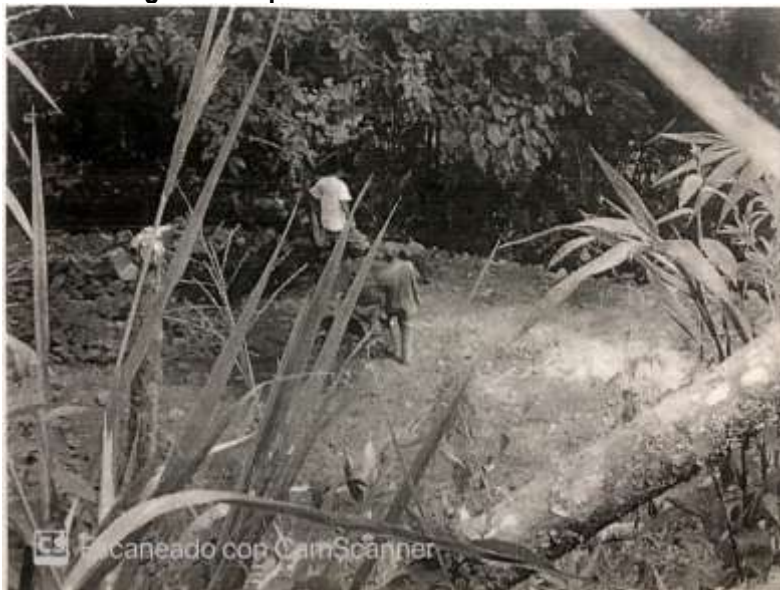
Tomada del informe de campo del 15 de enero de 2013