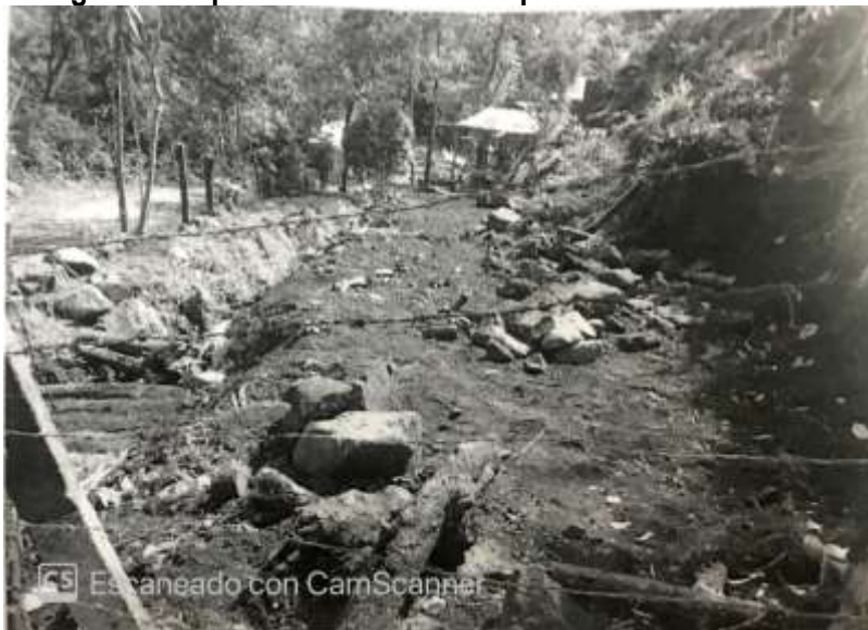
Tomada del informe de campo del 15 de enero de 2013