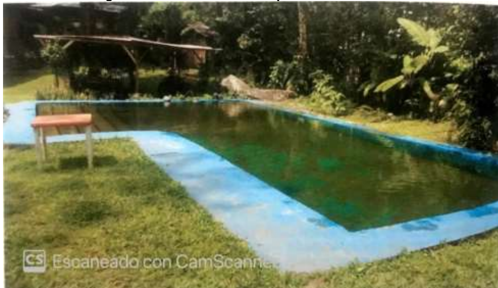
Tomada del concepto técnico inicial No. 20177660006036 del 12 de diciembre de 2017

Ahora bien, además de construir infraestructuras, los investigados realizaron lo siguiente: