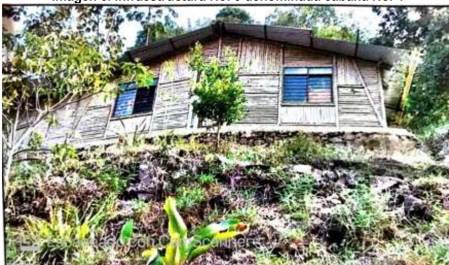
Imagen 5. Infraestructura No. 5 denominada cabaña No. 4

Tomada del Concepto Técnico No. 201576660000976, del 22 de abril de 2015