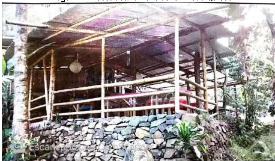
Imagen 7. Infraestructura No. 6 denominada Quisco

Tomada del Concepto Técnico No. 201576660000976, del 22 de abril de 2015