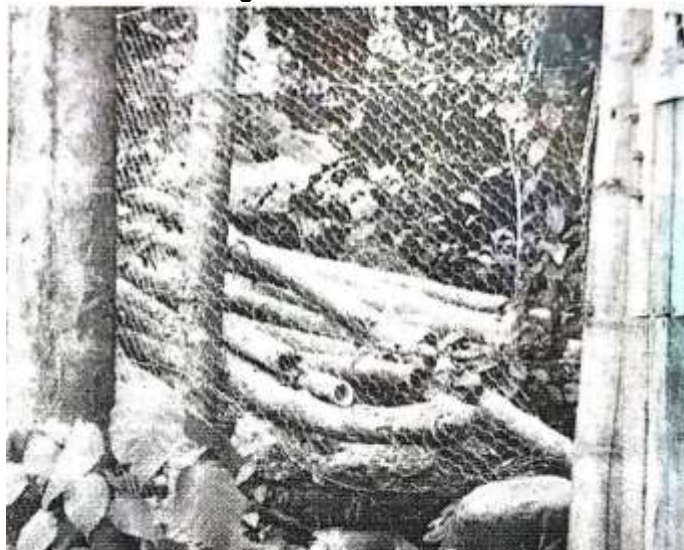
Imagen 16. Guadua talada