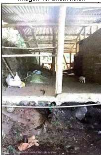
Imagen 15. Excavación

Tomada del Concepto Técnico No. 201576660000976, del 22 de abril de 2015