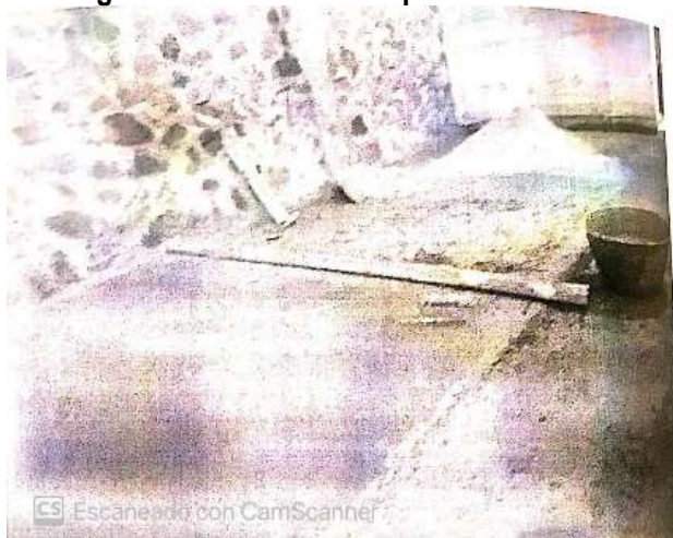
Imagen 14. Anilina mineral para construcción