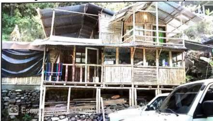
Imagen 4. Infraestructura No. 4 denominada casa principal