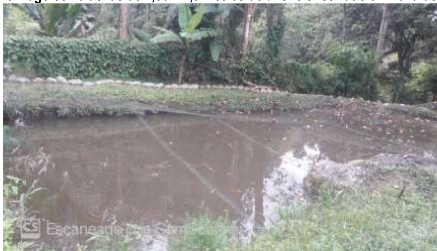
Tomada del informe de campo del 23 de junio de 2017