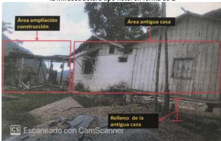
Imagen 1. Identificación del área de la antigua casa y del área expandida con la construcción de la infraestructura tipo hotel en forma de L

Tomada del Concepto Técnico No. 20167660000286