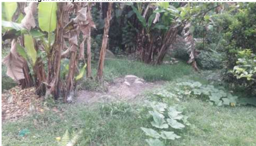
Imagen 27. Disposición inadecuada de excrementos de los cerdos

Tomada del informe de campo del 23 de junio de 2017.