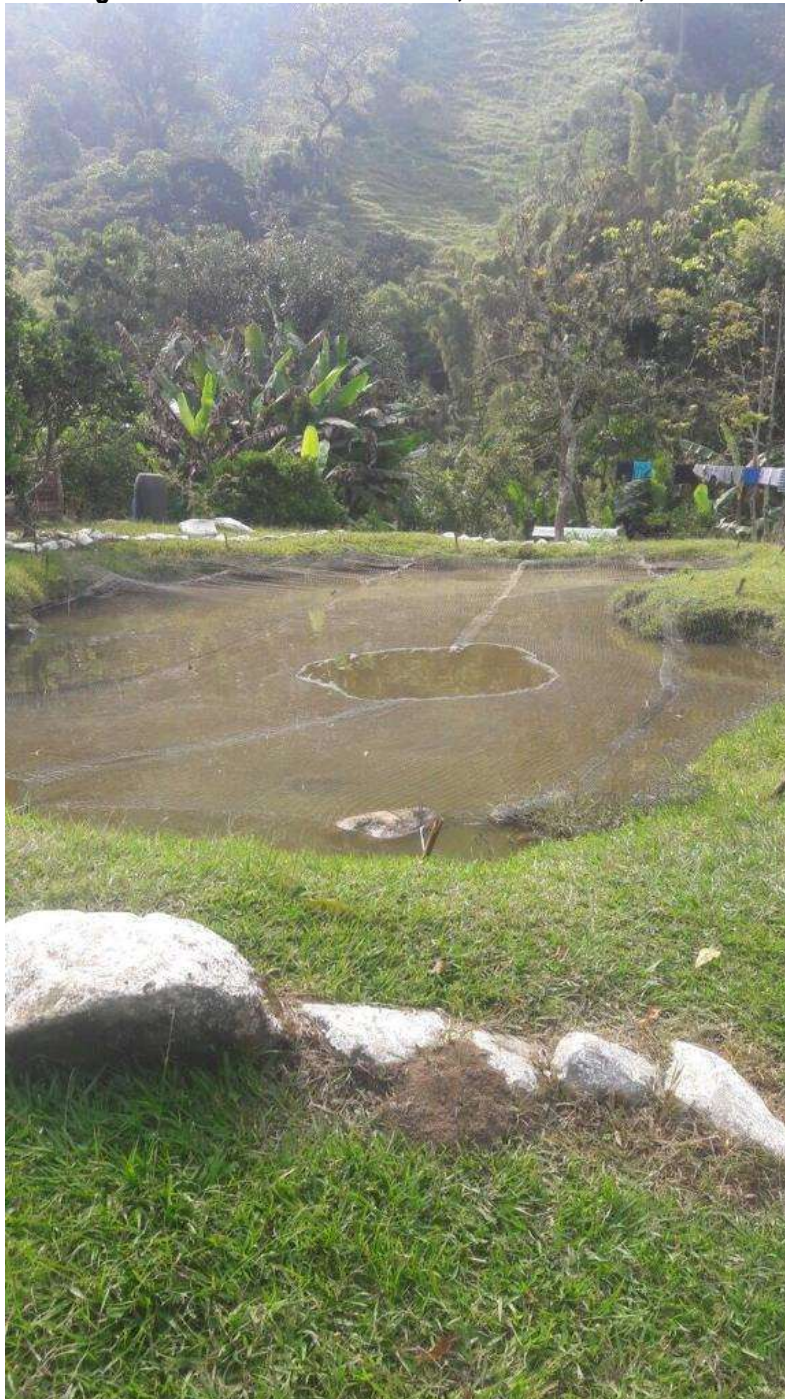
Tomada del informe de campo del 23 de junio de 2017