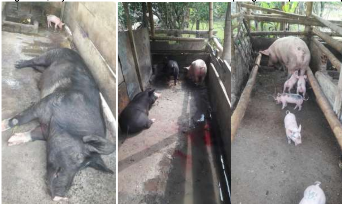
Tomadas del informe de campo del 23 de junio de 2017