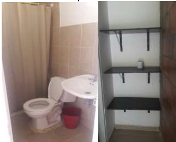
Tomadas del informe de campo del 23 de junio de 2017.

Imágenes 9 y 10. Baño y repisa para poner elementos, de una de las habitaciones de la infraestructura tipo “hotel” en forma de L