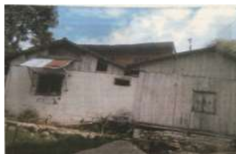
Fotografías tomadas del Concepto Técnico 20167660000286

Se procedió a inspeccionar la infraestructura en construcción ubicada posterior a la casa principal (chalet) la cual es una construcción en forma de L, reposa sobre un relleno con paredes en pedra de río y está compuesta por siete compartimientos, uno al parecer cumplirá la función de cocina y seis la función de habitaciones cada una con subdivisión para la instalación de baños, además de un corredor exterior en L conecta con los compartimientos. La construcción es una estructura de concreto con armado (columnas y vigas), con mampostería de ladrillo farol. La estructura tiene capacidad para un segundo nivel, lo cual se hizo evidente en la robustez de las columnas y vigas,