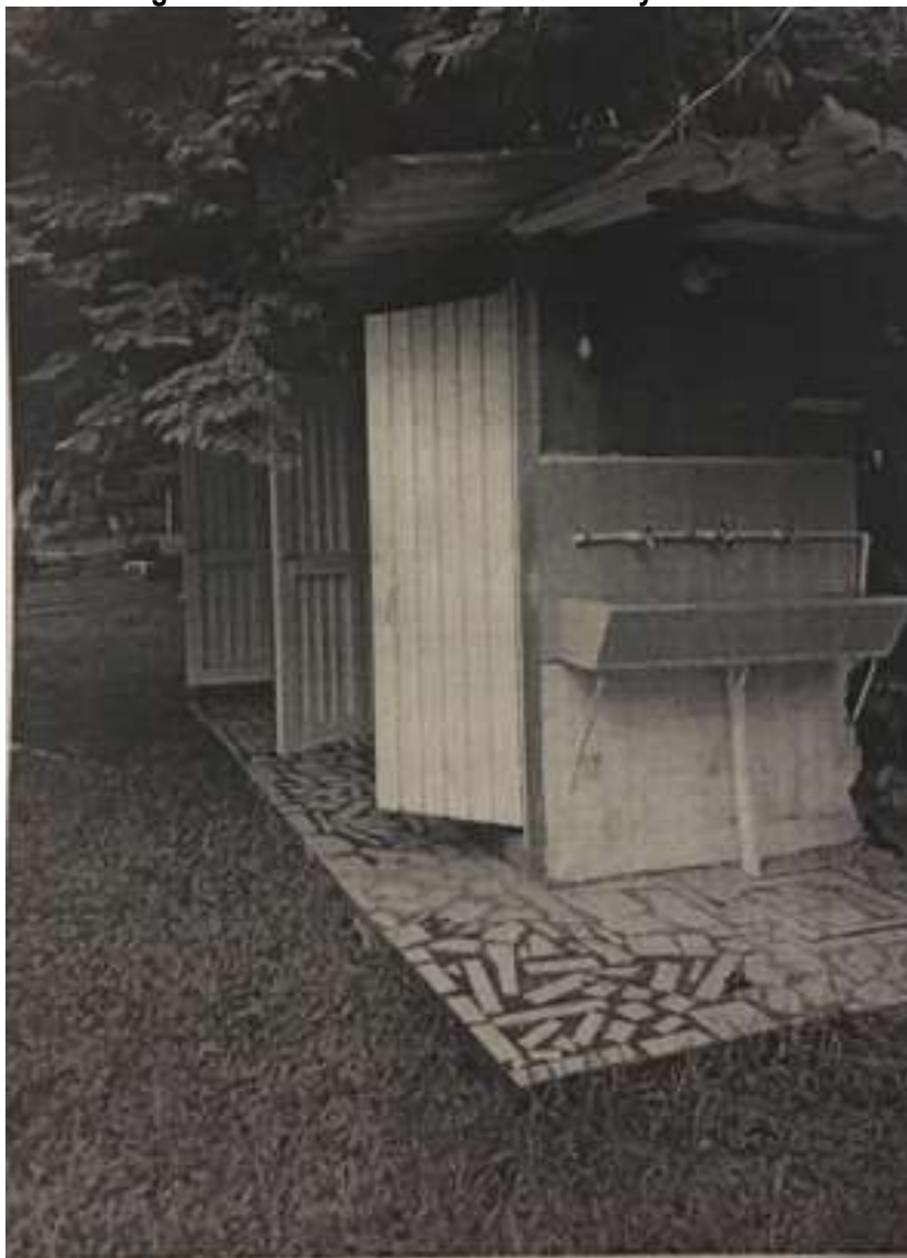
Imagen 18. Zona de baños con 2 duchas y 2 sanitarios