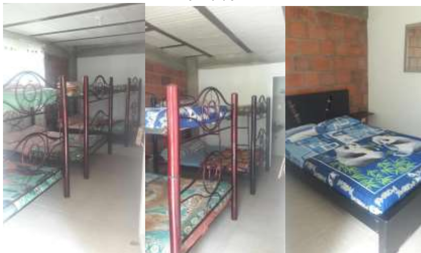
Tomadas del informe de campo del 23 de junio de 2017.