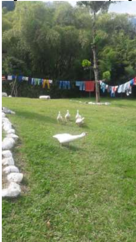
Tomada del informe de campo del 23 de junio de 2017