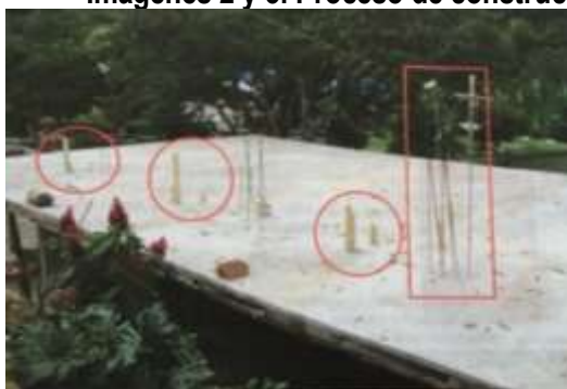
Imágenes 2 y 3. Proceso de construcción de infraestructura tipo “hotel” en forma de L

Tomada del Concepto Técnico No. 20167660000286