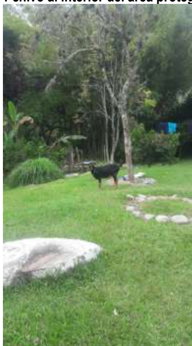
Tomada del informe de campo del 23 de junio de 2017