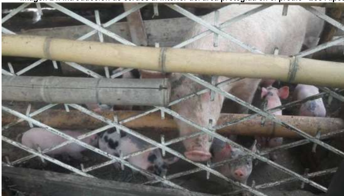
Tomada del informe de campo del 23 de junio de 2017.