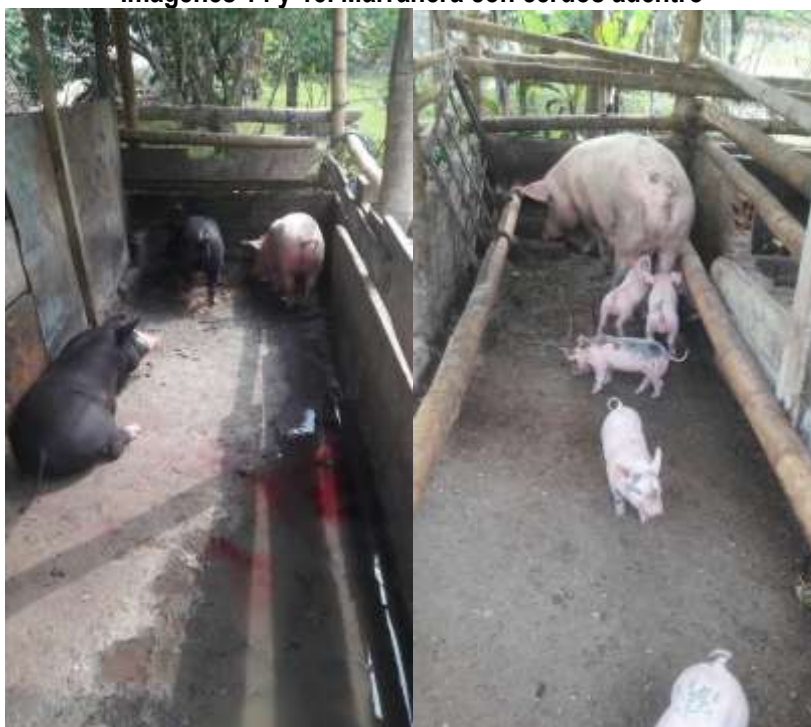
Tomadas del informe de campo del 23 de junio de 2017.