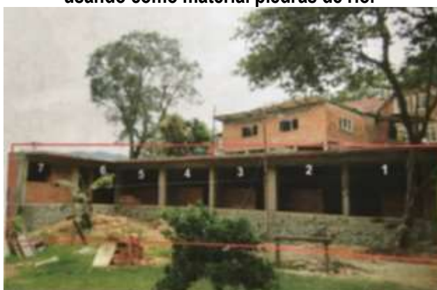
Imagen 4. infraestructura tipo “hotel” en forma de L con 7 compartimientos o habitaciones usando como material piedras de río.