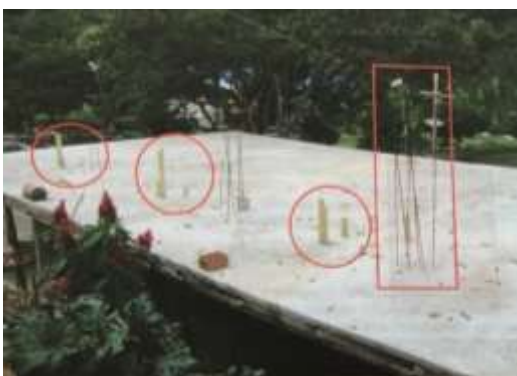
Fotografías tomadas del Concepto Técnico 20167660000286