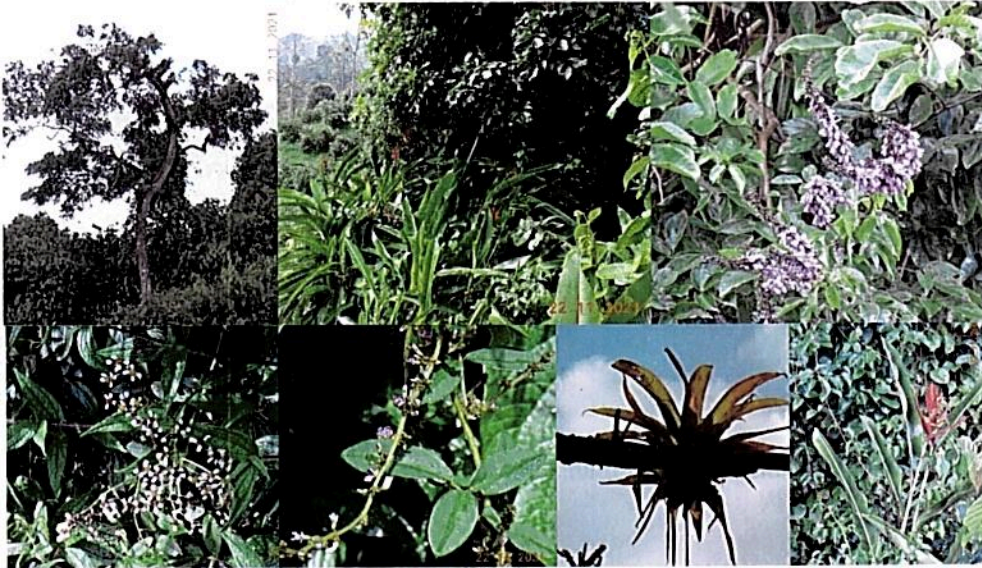
Figura 4. Muestra de vegetación presente en el predio "Lote San Francisco".