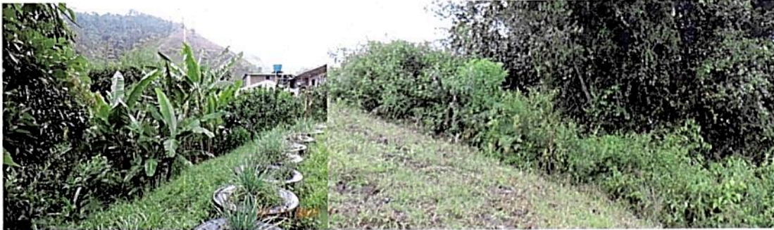
Figura 6. El área de amortiguación comprende una franja de vegetación secundaria baja de un ancho aproximado de 3 metros a las áreas de conservación y otro sector en los alrededores de la casa.