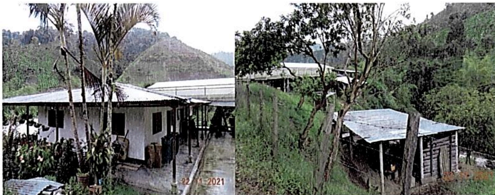
Figura 9. Zona de uso intensivo predio "Lote San Francisco".

Cubre un área de 0,0973 ha. correspondiente al 1,20% del área total para registrar. Se compone actualmente por la zona de vivienda, corrales y algunas construcciones para el beneficio del café.