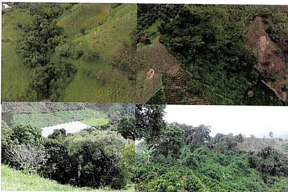
Figura 5. Vista general de las áreas de conservación: a la izquierda bosque ripario y a la derecha el relicto de bosque subandino en recuperación en el predio "Lote San Francisco".

El área de conservación comprende el 8,08% (0,6568 ha.) del total del área a registrar. Esta zona está conformada por dos sectores, el costado oriental del bosque ripario de la quebrada Mochilero, y al nororiente del predio donde se ubica un parche de bosque subandino en recuperación