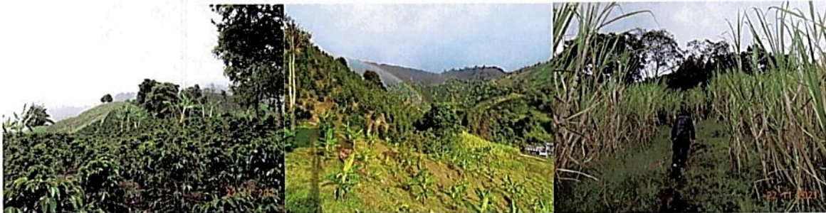
Figura 7. La principal actividad agrícola es el café seguido de plátano, aguacate y caña, se encuentran algunos sectores de pastos de corte.

Con un área de 6,9244 ha. corresponde al 85,17% de la reserva. Comprende principalmente cultivos de café y plátano con algunas parcelas de caña y pastos de corte, se encuentran algunos frutales de aguacate y guayaba.