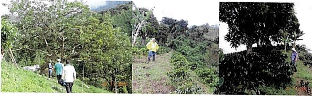
Figura 2. La visita fue realizada en compañía del propietario y dos funcionarios de la CAM.

La visita fue realizada el 22 de noviembre de 2021 en compañía del propietario y dos profesionales de la Corporación Autónoma del Alto Magdalena-CAM (Figura 2).