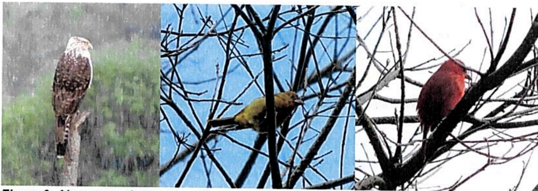
Figura 3. Algunos registros de avifauna registrados en los recorridos al predio "Lote San Francisco".

De acuerdo con la reseña descriptiva y lo comentado por el propietario de la finca, se encuentran especies de mamíferos como guara ( Dasyprocta fuliginosa ), borugo ( Cuniculus paca ), zarigüeya ( Didelphis marsupialis ), armadillo ( Dasyus novemcinctus ), conejo ( Sylvilagus sp. ), cusumbo ( Nasua olivacea ), ardilla ( Sciurus sp. ), zorro ( Cerdocyon thous ), ulamá ( Eira barbara ), comadreja ( Mustela sp. ), perro de monte ( Potos flavus ). Dentro de las aves se reportan: soledad ( Momotus aequatorialis ), toche pico de plata ( Ramphocelus dimidiatus ), pavas, gavilanes, carpinteros toches, loros, canarios, garrapateros entre otros. En reptiles se menciona la presencia de corales ( Micrurus sp. ), talla x ( Bothrops sp. ) serpiente cazadora, camaleones, entre otros.