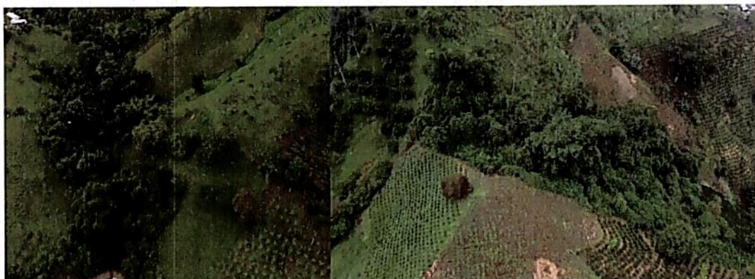
Figura 1. A la izquierda bosque ripario asociada a la quebrada Mochilero, y a la derecha una muestra de bosque subandino en recuperación.

De acuerdo con los recorridos realizados en la visita técnica y la documentación consultada se evidenciaron relictos de bosque subandino en recuperación al nororiente del predio y un bosque ripario hacia el suroccidente del mismo, muestras expresadas en coberturas de bosques abiertos bajos con sectores de vegetación secundaria alta y baja (Figura 1).