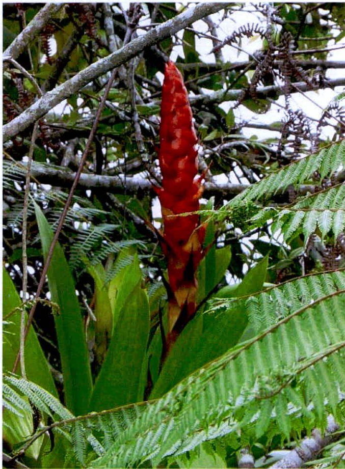
Imagen 2. Vegetación presente en la RNSC Manzanares

Al momento de la visita a la RNSC Manzanares, se pudo observar las siguientes especies, Arrayanes, yarumo, chagualos, uvo, Miconia, robles, heliconias, cauchos, encenillos, arrayanes, punta de lanza, helechos macho, palma boba, nacederos, los que más se identifican helechos, musgos y líquenes.