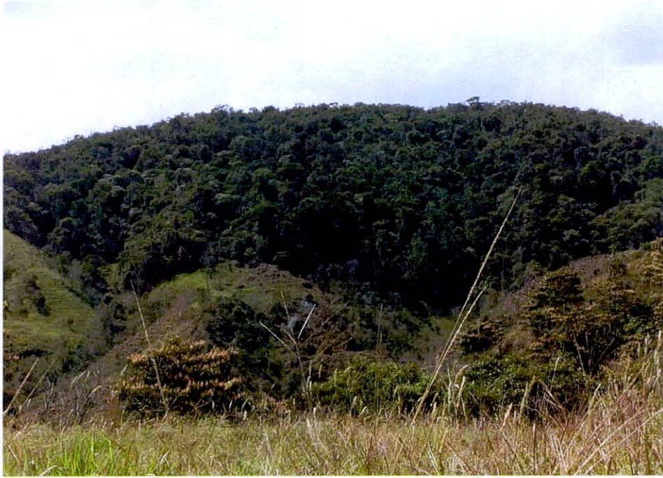
Imagen 1: Bosque (bp – MB), en estado conservado