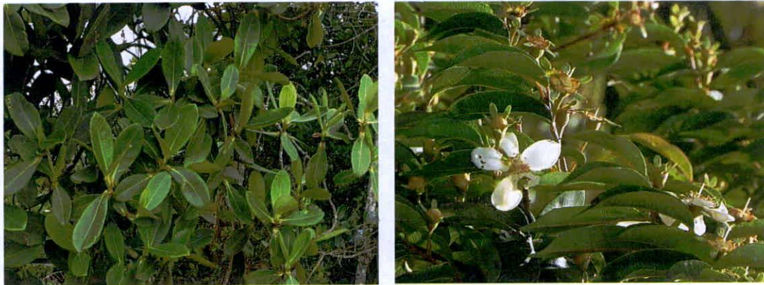
Imagen 3 y 4. Vegetación presente en la RNSC Manzanares