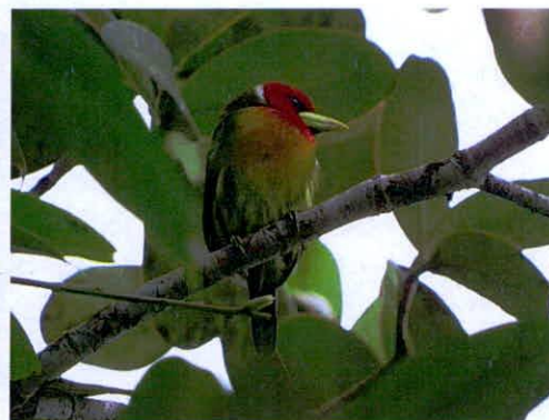
Imagen 8: Aves de la RNSC Manzanares