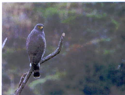
Imagen 7: Aves de la RNSC Manzanares