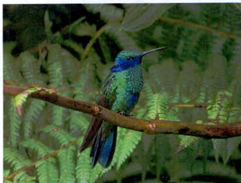
Imagen 5: Aves de la RNSC Manzanares

"A partir de la información obtenida en muestreos de biodiversidad en predios cercanos a este, con el fin de consolidar información relevante de la zona, se pudieron advertir la presencia de 117 especies de aves, las cuales se encuentran agrupadas en cinco Ordenes, 31 familias, 69 géneros, 82 especies y 31 subespecies; de éstas, se identificó una especie y 10 subespecies endémicas algunas de las cuales fueron registradas 3 y algunas fotografiadas. Figura 3.