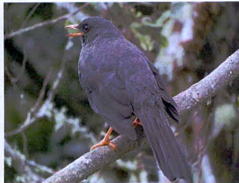
Imagen 6: Aves de la RNSC Manzanares