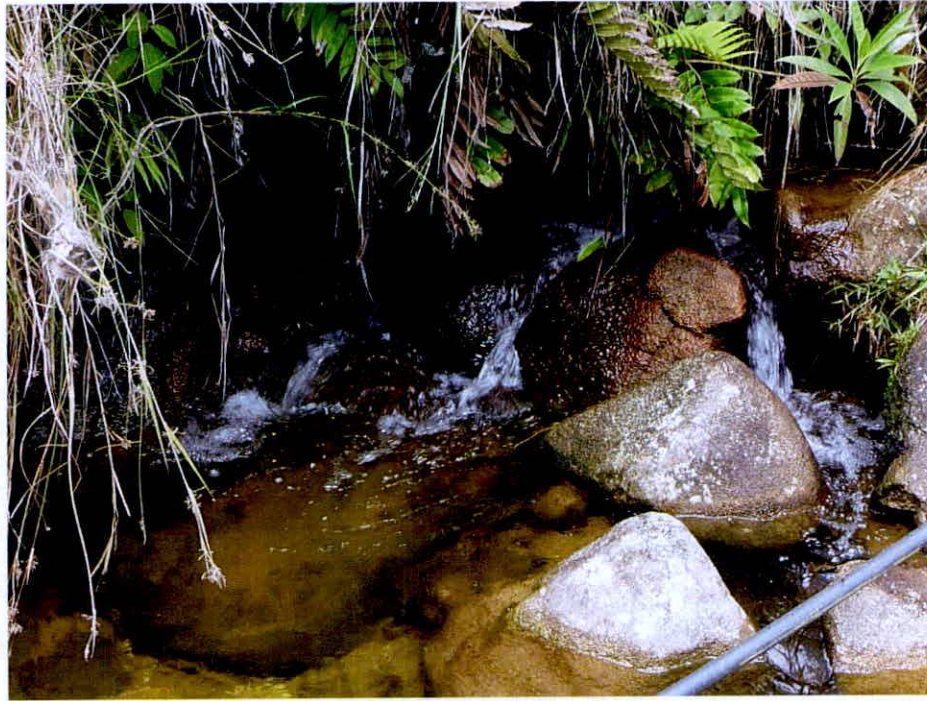
Imagen 9. Fuente hídrica dentro la RNSC Manzanares