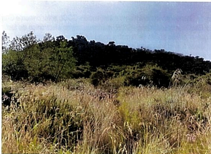
Imagen 14. Vivienda RNSC "LOROS ANDINOS".