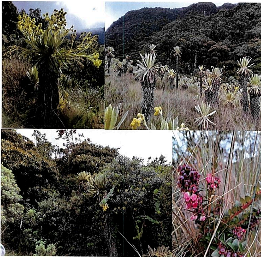
Imagen 3 a la 6: Flora presente en la Reserva Natural de la Sociedad Civil 169-18 "LOROS ANDINOS".

La Reserva Natural de la Sociedad Civil "LOROS ANDINOS", posee una variedad de especies de flora en diferentes estados de sucesión típicas del ecosistema de Bosque Andino, Altoandino y Páramo dentro de las que se pueden resaltar: Frailejón, Siete cueros, mano de oso, tuno, variedades de helechos, orquídeas, musgos, epifitas y otras especies típicas de estos ecosistemas.