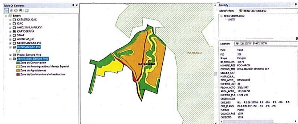
Figura 1. Traslape del predio "Lote", identificado con FMI No. 368-21399 y código catastral No. 734830003000000020025000000000 con la comunidad indígena "Pijao Pocharco". Fuente: Capa Resguardos Indígenas ANT 2021.

La profesional de apoyo cartográfico del Grupo de Trámites y Evaluación Ambiental -GTEA, mediante correo electrónico de fecha 22 de octubre de 2021 informó que los predios denominados "Lote" identificado con FMI No. 368-21399 y "Lote" identificado con FMI No. 368-31523 no se traslapan con Comunidades Negras, áreas SINAP, Solicitudes Mineras o Títulos Mineros a la fecha; no obstante, el predio denominado "Lote", identificado con FMI No. 368-21399 y código catastral No. 734830003000000020025000000000, presenta traslape parcial con la comunidad indígena "Pijao Pocharco" de acuerdo con la capa de Resguardos Indígenas de la Agencia Nacional de Tierras- ANT 2021 (Figura 1).