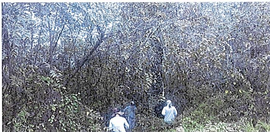
Imagen 1. Zona de Conservación identificada en la RNSC "SIEMPRE VIVO". Fuente. Visita técnica realizada por CORTOLIMA.

se encuentra en las inmediaciones del río Magdalena, es un área en la sirve como corredor biológico, este va desde el río Magdalena hasta la quebrada Damas... se encuentra un remanente de bosque nativo sin intervenciones alberga gran número de especies de flora y fauna locales; así también se encuentran extensiones de bosque de galería que cumplen funciones de protección de afluentes hídricos al interior del predio, este siendo el tramo final a desembocar al río Magdalena...".