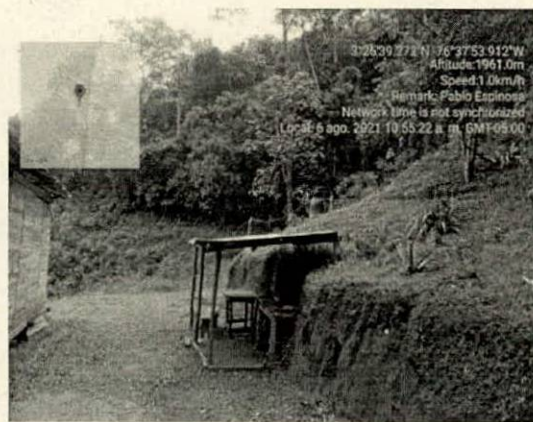
Fotografía 2. Cocineta y lavadero improvisado, sin desagüe.