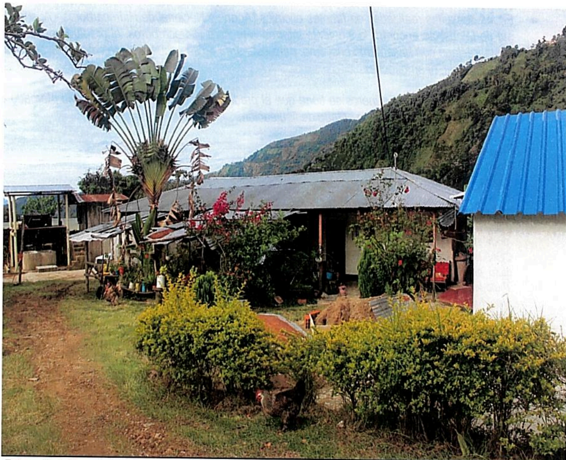
Fotografía 4. Zona de Uso Intensivo e Infraestructura de la RNSC "Buenos Aires", casa de habitación con capacidad de hospedar 6 personas, beneficiadero para café y galpón de pollos al fondo.

4.5. ZONA DE USO INTENSIVO E INFRAESTRUCTURA: Cuenta con un área de 0,1319 ha, 2,66 % en esta se encuentran cinco construcciones de infraestructura; una de uso humano, una para el beneficio del café, un galpón, un vivero, otra donde está ubicado el biodigestor. La casa con techo en teja de zinc en la coordenada N-03°50'36,75" W-075°34'47,88" .