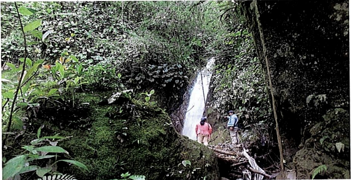
Fotografía 2. Zona de amortiguación y manejo especial de la RNSC "Buenos Aires", ronda hídrica de la quebrada San Jorge. Fuente: visita técnica PNN Las Hermosas 17 de abril de 2021.

Corresponde al 3 % del predio y está compuesta por el área de transición entre el paisaje antrópico y las zonas de conservación, esta zona consta de una cobertura vegetal en proceso de sucesión inicial en la cual predominan hierbas altas y algunas especies de arbustos pioneros, se encuentra de igual forma vegetación en la ronda hídrica de la quebrada San Jorge y presenta un área de 0,1490 ha en la coordenada N 03°50'33,65" W 075°34'47,77".