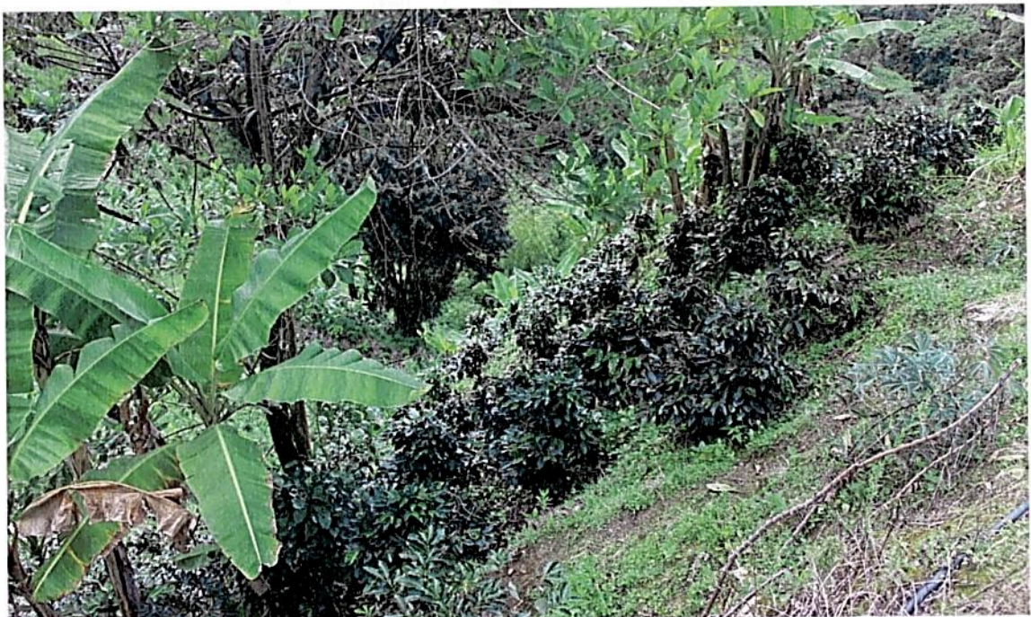
Fotografía 3. Zona de Agrosistemas de la RNSC "Buenos Aires", vegetación secundaria con actividades agropecuarias sostenibles, de regular intensidad. Fuente: visita técnica PNN Las Hermosas 17 de abril de 2021.

N 03°50 '38,33 `` W 075°34'52,33"; N03°50'35,81"W075°34'49,22"; N03°50'36,18"W075°34'46,76".