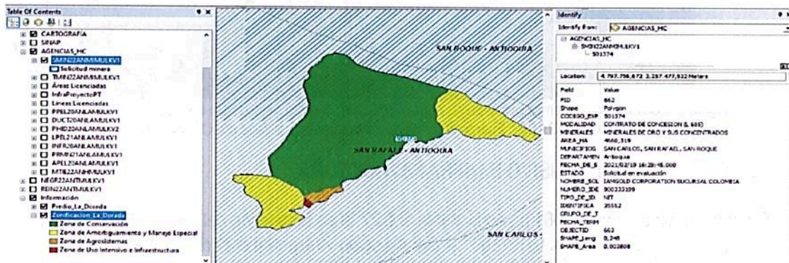
Figura 7. Traslape del predio denominado "Rural" FMI No. 018-1160, que conforma la RNSC " LA DORADA" en la vereda La Dorada, Municipio de San Rafael.

Teniendo en cuenta dicha revisión se identificó un Traslape con Solicitud Minera - ANM: 501374 (Figura 7).