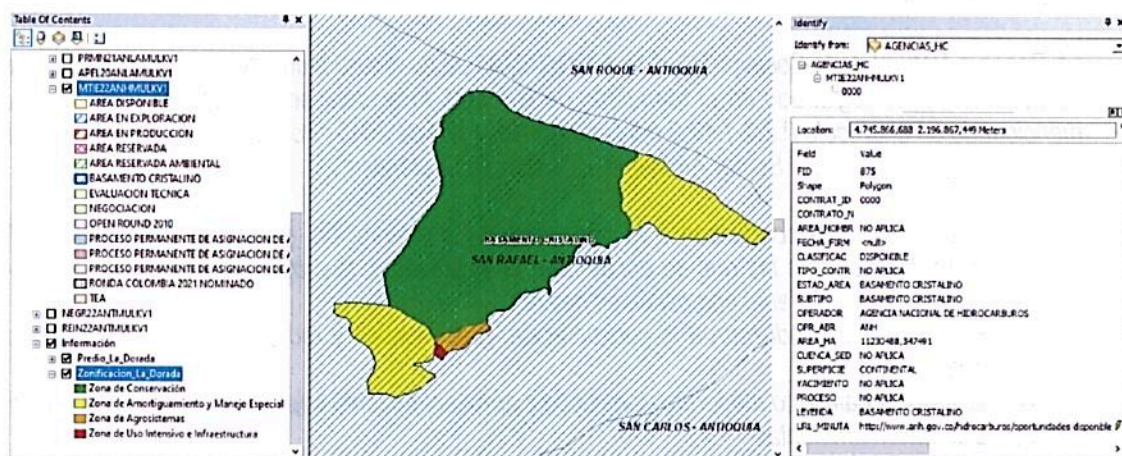
Figura 8. Traslape del predio denominado "Rural" FMI No. 018-1160, que conforma la RNSC " LA DORADA" en la vereda La Dorada, Municipio de San Rafael.

Presenta otro traslape con B ASAMENTO CRISTALINO- Mapa de Tierras ANH con clasificación disponible: