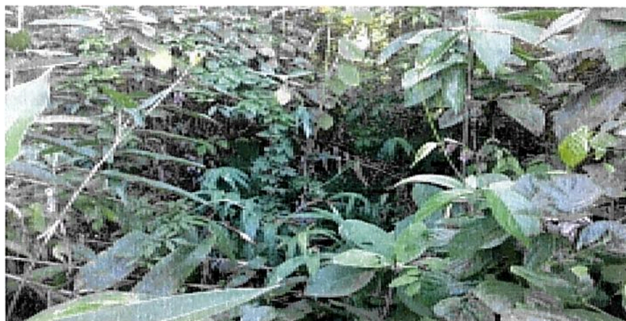
Figura 2. Composición de la flora en la RNSC "LA DORADA".

De acuerdo con el informe allegado, la siguiente es la flora presente en la reserva "LA DORADA " es "...". Algunas de las especies de plantas que pueden encontrarse al interior de la reserva son: el pacó ( Cespedessia spathulata ), el dormilón ( Vochysia ferrugínea ), el taibará ( Miconia elata ), el aguanoso ( Hedyosmum bonplandiaum ), el carate ( Vismia sp. ), el guamo ( Inga sp. ), zapotillo ( Pouteria sp. ), garrapato ( Hirtella sp. ), cafetillo ( Psychotria sp. ), nigüito ( Miconia sp. ), guayabo de mico ( Bellucia pentámera ), lechero ( Ficus sp. ), anón de monte ( Annonaceae sp. ), chingalé ( Jacarana copaia ), comino ( Aniba perutilis ), entre otros que no se han identificado."..."