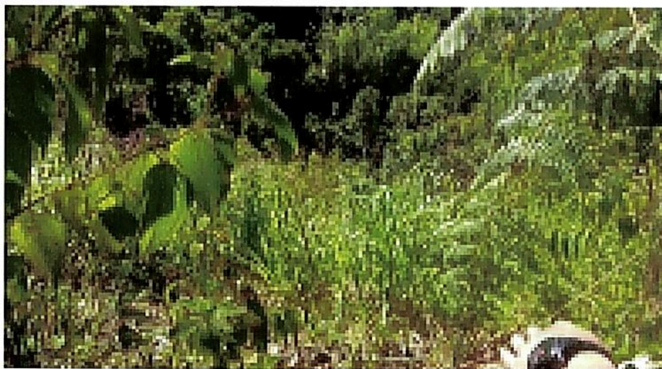
Figura 5. Zona de Amortiguación y Manejo Especial presente en el predio "Rural" inscrito bajo el folio de matrícula inmobiliaria No. 018-1160, que conforma la RNSC "LA DORADA".

Esta zona corresponde al 25,30 % del total del área a registrar, es decir a 20,2269 Ha del predio "Rural" inscrito bajo el folio de matrícula inmobiliaria No. 018-1160. "..." Esta zona está destinada para la restauración de los ecosistemas naturales de la zona, la preservación de ecosistemas boscosos, actividades turísticas sostenibles y la implementación de proyectos de apicultura y meliponicultura. "..."