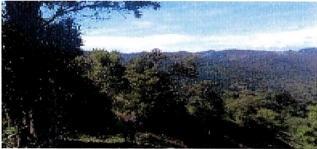
Figura 6. Zona de Agrosistemas presente en el predio "Rural" inscrito bajo el folio de matrícula inmobiliaria No. 018-116., que conforma la RNSC "LA DORADA".