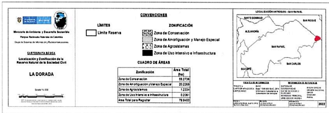
Figura 3: salida grafica de la zonificación de la RNSC LA DORADA