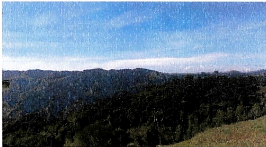
Figura 1 . Zona de Conservación

Las buenas condiciones de vegetación al interior de la reserva permiten mantener actividades de apicultura. De hecho, la apicultura es una de las actividades económicas más representativas de "La Dorada", y es gracias a que las abejas encuentran a su disposición lugares para obtener su alimento."..."